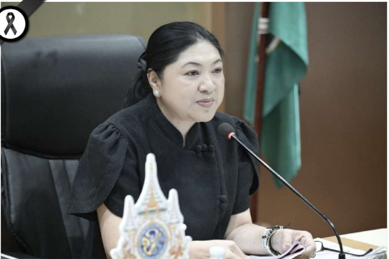
“รองปลัดฯ นฤมล” นั่งหัวโต๊ะประชุมคณะอนุกรรมการขับเคลื่อนนโยบายการเปลี่ยนแปลงภูมิอากาศด้านการเกษตร