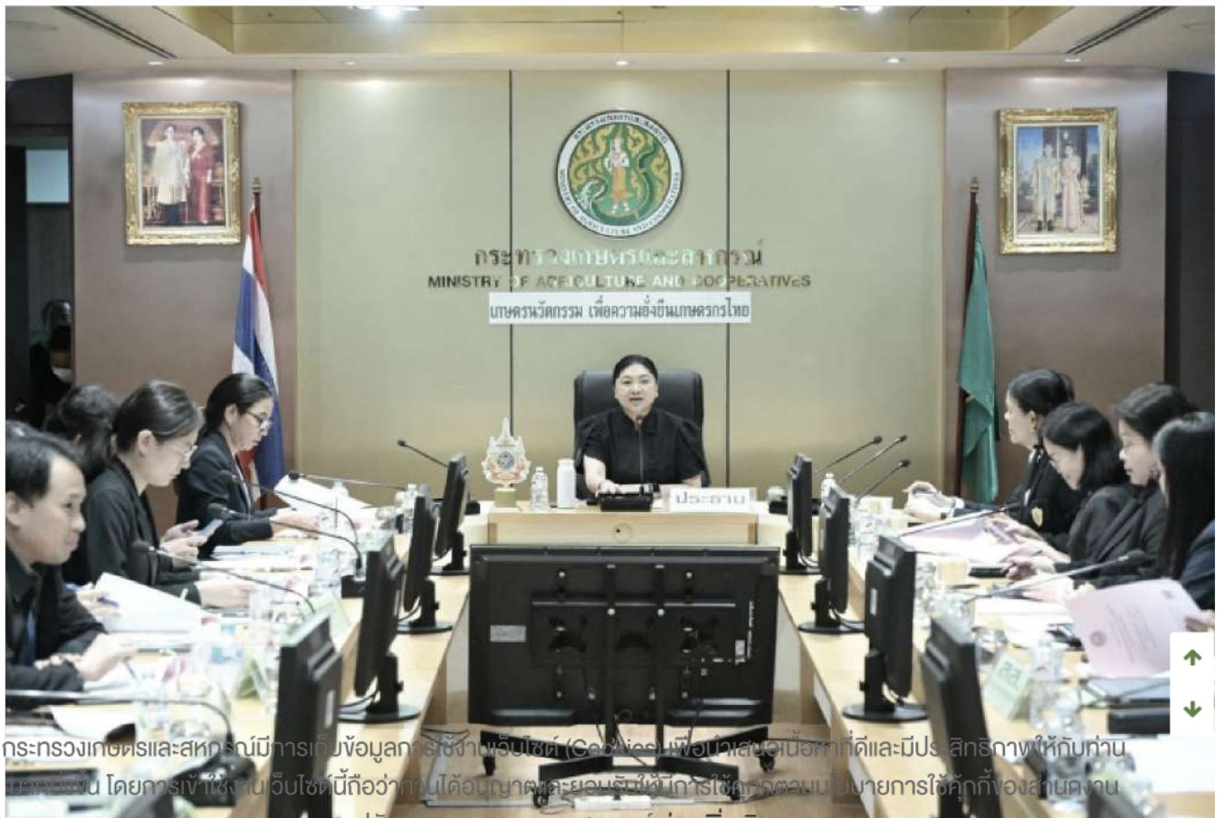
กระทรวงเกษตรและสหกรณ์มีการเก็บข้อมูลการใช้งานเว็บไซต์ (Coed) เพื่อนำเสนอเนื้อหาที่ดีและมีประสิทธิภาพให้กับท่าน ผู้ใช้งาน โดยการใช้เว็บไซต์นี้ถือว่าท่านได้อนุญาตและยอมรับให้มีการใช้การควบคุมนโยบายการใช้คุกกี้ของสำนักงาน ปลัดกระทรวงเกษตรและสหกรณ์ อ่านเพิ่มเติม