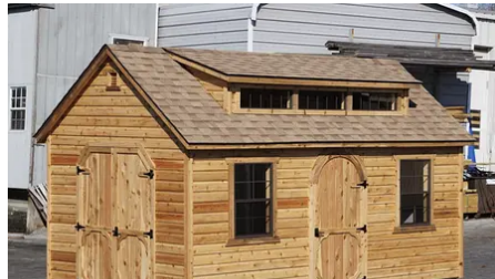
: ราคา บ้านสำเร็จรูปในปี 2024 อาจทำให้คุณประหลาดใจ

ตามนิตินัยขณะนี้มีส่วนร่วมอุดมการณ์มี สส. 24 คน ยังมี สส. ที่หัวใจเดียวกันอีกสัก 10 คนบวกๆ คงไปเรื่อยๆ ตรงนี้ ไม่มีลิมิต ถ้ามีคนอยากร่วมอุดมการณ์ด้วย เรายินดีร่วมงานกับทุกคน