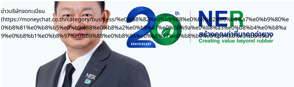
( https://moneychat.co.th/ner-recovers-brokers-set-5-60-baht-target-amid-global-rubber-price-surge/ )

26 พ.ค. 2026( https://moneychat.co.th/2026/05/26/ ) 12