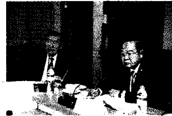
พล.อ.ประวิตร วงษ์สุวรรณ (ขวา) เป็นประธานการประชุม กนป.

●●● สองเกลอ ขอฝากอีกครั้งครับ เรื่องของยางพารา ดูเหมือนว่าพ่อคนกลางในท้องถิ่นเอาไรเปรียบเกษตรกรที่กำลังได้รับความเดือดร้อนจากราคายางพาราดกต่ำเหลือเกิน แม้ทุกวันนี้ราคาประมูล ณ ตลาดกลางยางพารา อ.หาดใหญ่ จ.สงขลา ราคา ยางแผ่นดิบอยู่ที่ กก.ละ 58.10 บาท ยางรมควันชั้น 3 อยู่ที่ กก.ละ 62.70 บาท ก็ตาม แต่พ่อค้าที่ไปซื้อในท้องถิ่น ยางแผ่น กก.ละ 45.65 บาท นำยางสดอยู่ที่ กก.ละ 40.00