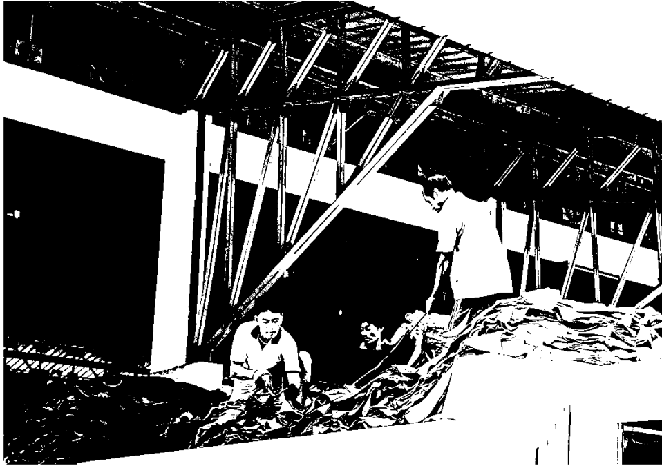
ลับกะลັก