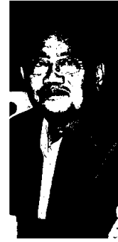
อำนวยการ ประดิษฐ์

ล้นพบผิวดินไม่เลี้ยง แบงก์รัฐทุ่ม2แสนล. แพคเกจช่วยคนจน ตั้งเวทีคุยปีโตรฯ21