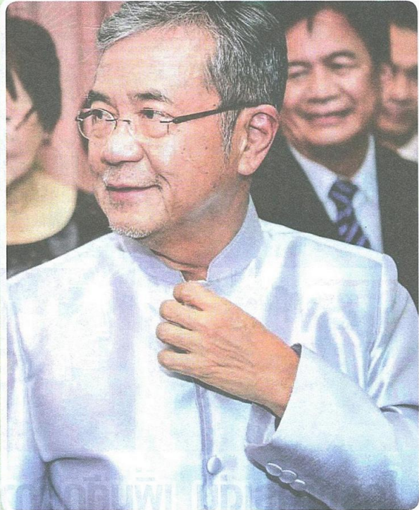
นายปิติพงษ์ พิษบุญ ณ ออยุธยา รัฐมนตรีว่าการกระทรวงเกษตรและสหกรณ์

นับตั้งแต่อดีตจนถึงปัจจุบัน ประเด็นหนึ่งที่คนไทยทุกคนต่างให้การยอมรับอย่างไม่มีข้อกังขา นั่นคือ ความสำคัญของการเกษตรที่มีต่อสังคม เศรษฐกิจ และการขับเคลื่อนประเทศให้ก้าวไปข้างหน้า เพราะภาคการเกษตรไทยมีได้ตรงสถานะเป็นเพียงแต่หน่วยหนึ่งทางสังคมเท่านั้น แต่ยังคงมีความหมายไปถึงความเป็นฐานการผลิตอาหารที่เลี้ยงปากเลี้ยงท้องคนทั้งประเทศ และยังมีเหลือมากพอที่จะส่งออกไปขายเพื่อนำเงินตรา กลับเข้ามาพัฒนาประเทศอีกด้วย