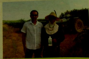
คุณะ กับสวนป่าล้มที่เพิ่งเริ่มทำ แต่ก็ประสบปัญหาต้นโตช้าและเป็นโรค จึงใช้เอ็นช่วยในเรื่องของโรคใบจุดที่เกิดขึ้นในช่วงเข้าฤดูฝน

ยางพารา ถึงจะเป็นพืชยืนต้นที่เกษตรกรมองดูแล้วว่ามันไม่จำเป็นต้องดูแลและบำรุงอะไรมากมาย แต่จริงๆ แล้วมันง่าย อย่างที่เห็นเลยคือ ยางพาราจำเป็นต้องดูแลรักษาให้ต้นอย่างมีอายุอย่างน้อย 25-30 ปี และการที่จะให้ยางพารามีผลผลิตที่ดีนั้น เป็นสิ่งที่ทำให้ยากพอสมควร และเกษตรกรไม่สามารถหลีกเลี่ยงได้เลยในสิ่งที่ต้องประสบพบเจอ ปัญหาของการปลูกยางพารา เรื่องของโรคระบาดในระยะใดระยะหนึ่งของการทำงานสวนยาง เพราะพื้นที่ปลูกที่นิยมปลูกในปัจจุบันก็ค่อนข้างต่อโรคเหลือเกิน โรคของยางพาราที่พบในประเทศไทยนั้นสามารถเกิดขึ้นได้ทุกระยะของการเจริญเติบโต และทุกส่วนของต้นยาง แม้ว่ายางพาราจะมีโรคระบาดอยู่หลายชนิด แต่ส่วนใหญ่มีสาเหตุจากเชื้อรา ซึ่งสามารถจำแนกออกเป็นส่วนต่างๆ ของต้นยาง ที่สามารถถูกเชื้อโรคเข้าทำลาย ได้แก่ โรคใบ โรคกิ่งก้าน ลำต้น และโรคราก เป็นต้น