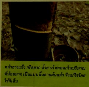
หน้ายางแข็ง กรดตก น้ำยางไหลออกในปริมาณที่น้อยมาก เป็นแบบนี้หลายต้นแล้ว จึงแก้ไขโดยใช้เอ็น

หลังจากนั้น พระยารัษฎานุประดิษฐ์ ได้เสด็จไปประโชนของยางพารา จึงส่งคนไปเรียนวิธีปลูกยางเพื่อมาสอนประชาชน คนที่ทวนส่งไปก็ล้วนแต่เป็นเจ้าเมือง นายอำเภอ กำนัน และผู้ใหญ่บ้านทั้งสิ้น พร้อมกับนำทวนที่ส่งให้กำนัน ผู้ใหญ่บ้าน นำพันธุ์ยางไปแจกจ่าย และส่งเสริมให้ราษฎรปลูกทั่วไป ซึ่งในยุคนั้นอาจกล่าวได้ว่า เป็นยุคต้นยาง และชาวบ้านเรียกยางพาราว่า "ยางเทศา" ปัจจุบันประเทศไทยมีพื้นที่ปลูกยางทั้งประเทศประมาณ 12 ล้านไร่กระจายกันอยู่ในภาคใต้ ภาคตะวันออก และภาคตะวันออกเฉียงเหนือ ซึ่งเป็นแหล่งปลูกยางใหม่ การพัฒนาอุตสาหกรรมยางของประเทศ ได้เจริญรุดหน้าเรื่อยมาจนทำให้ประเทศไทยเป็นประเทศที่ผลิตและส่งออกยางได้มากที่สุดในโลก