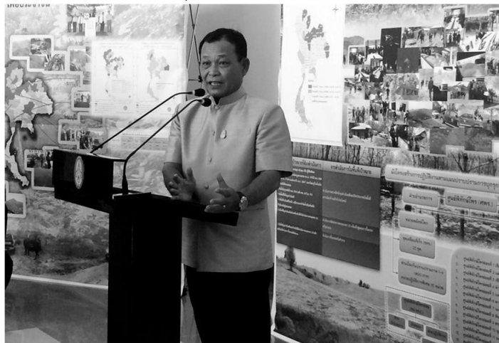
ปลูกยางรุกป่า - พล.อ.ดาว์พงษ์ รัตนสุวรรณ รมว. ทักษะการธรรมชาติและสิ่งแวดล้อม เป็นประธานการประชุมบูรณาการหน่วยงานส่วนราชการที่เกี่ยวข้อง ในการสนับสนุนการบังคับใช้กฎหมายต่อพื้นที่ป่าที่ถูกบุกรุกปลูกยางพารา เมื่อวันที่ 22 พ.ค. ที่กองทัพอากาศที่ 1

พล.อ.ดาว์พงษ์กล่าวว่า คนที่ไม่มีที่ดินทำกินขึ้นทะเบียนไว้กับกระทรวงเกษตรและสหกรณ์ประมาณ 3.3 แสนราย ปีนี้รัฐบาลตั้งเป้าช่วยเหลือ 2 หมื่นราย ส่วนม.ค.ค.ปี 41 รองรับอีก 6 แสนราย ตัวเลขยังไม่นิ่ง นายกฯสั่งให้กระทรวงเกษตรฯสำรวจอีกครั้ง เชื่อว่าจะใช้เวลามากหลายรัฐบาลเพราะรัฐบาลนี้ทำอะไรก็ไม่ทันแต่จะปูพื้นฐานไว้ ส่วนพื้นที่ที่ถูกบุกรุกทำสวนยางพารามีประมาณ 5.5 ล้านไร่ ทำให้นายางพาราล้นตลาด ดังนั้นปีนี้ตั้งเป้าหมายนำพื้นที่คืน 6 แสนไร่ทั่วประเทศ ปี 59 ตั้งเป้าไว้ 9 แสนไร่ รวมประมาณ 1.5 ล้านไร่ที่เป็นพื้นที่ของนายทุน