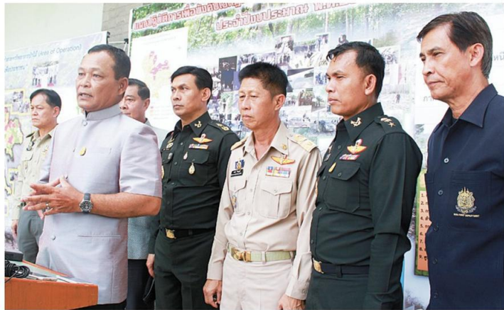
เอาจริง - ปัจจุบันมีพื้นที่ป่าที่ถูกบุกรุกนำไปปลูกยางพาราทั่วประเทศกว่า 4 ล้านไร่ กระทรวงทรัพยากรเตรียมปฏิบัติการยึดคั้นพื้นที่ป่าในวันที่ 1 มิถุนายน 2558 โดยดึงเป้ายึดคั้นพื้นที่ในภาคอีสานให้ได้อย่างน้อย 9 หมื่นไร่ จาก 4 แสนไร่ภายในปีนี้

พล.อ.ดาวพงษ์ รัตนสุวรรณ รัฐมนตรีว่าการกระทรวงทรัพยากรธรรมชาติและสิ่งแวดล้อม เปิดเผยมว่า กระทรวงทรัพยากรธรรมชาติและสิ่งแวดล้อม ได้วางแผนยึดคั้นพื้นที่ที่ถูกบุกรุกปลูกยางพาราทั่วประเทศ ซึ่งส่วนใหญ่ มีทั้งกลุ่มนายทุน นอมินีกลุ่มนายทุน และชาวบ้านเป็นผู้บุกรุก โดยตนตั้งเป้าดำเนินการในพื้นที่ที่เป็นนายทุนบุกรุก และไม่มีเอกสารสิทธิเป็นอันดับแรก ทั้งนี้ ข้อมูลในภาคอีสานมีการบุกรุกพื้นที่ป่าปลุกยางพารา มากกว่า 4 แสนไร่ จากพื้นที่ป่าทั่วประเทศ ที่ถูกบุกรุกปลูกยางพารา 4 ล้านไร่ ในพื้นที่ภาคอีสานตั้งเป้ายึดคั้นกลับมาให้ได้