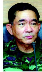
พล.ท.ปราการ ชลยุทธ

มทท.4 ส่งมอบถนนพหลโยธิน 2 เส้น ในนครราชสีมา รวม 9.7 กม. งบประมาณแต่ใช้เงินค้ำค่า เน้นซื้อยางจากชาวบ้านเป็นหลัก ร่นเวลาเดินทางจาก 40 นาที เหลือแค่ 10 นาที (อ่านต่อหน้า 2)