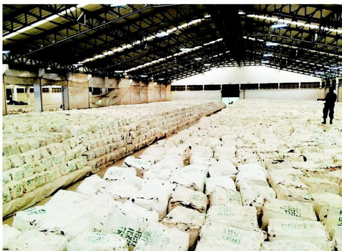
เช็คสต็อก - คณะทำงานตรวจสอบสต็อกยางพาราเข้าตรวจนับจำนวนยางในโกดังของ ตลาดกลางยางพารา จังหวัดสุราษฎร์ธานี ด้วยการใช้อธิกรตรวจนับก่อนยกต่อพื้นที่ ตารางเมตร และนำมาคำนวณหาปริมาณยางทั้งหมดที่มีอยู่ในโกดัง

พล.ต.เรืองศักดิ์ สุวรรณาคะ รอง แม่ทัพภาค 4 เปิดเผยภายหลังการตรวจ สอบสต็อกยางที่โกดังตลาดกลางยางพารา ว่า เบื้องต้นพบว่ายางในโครงการพัฒนา ศักยภาพผลผลิตยางพาราเพื่อรักษา