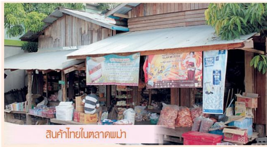
สินค้าไทยในตลาดพม่า