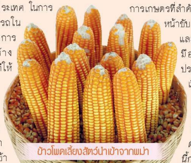
ข้าวโพดเลี้ยงสัตว์นำเข้ามาจากพม่า

ทำโครงการส่งเสริมการค้าชายแดนของสหกรณ์เพื่อสร้างเครือข่ายการค้าระหว่างประเทศบริเวณชายแดนเพื่อเตรียมความพร้อมเข้าสู่ประชาคมเศรษฐกิจอาเซียน (เออีซี) โดยใช้ขบวนการสหกรณ์เข้ามาดำเนินการนำเข้าและส่งออกสินค้าเกษตรที่สำคัญ ซึ่งขณะนี้กำลังเดินทางข้ามเคลื่อนไม่ในทิศทางที่ดี และมีการสร้างความร่วมมือทางการค้าชายกับประเทศเพื่อนบ้านอย่างต่อเนื่อง