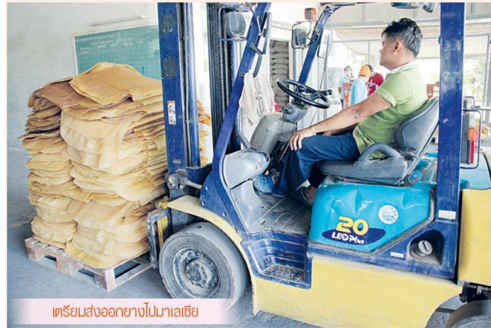
เตรียมส่งออกยางไปมาเลเซีย