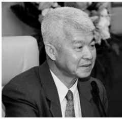
เลอศักดิ์ รั้วตระกูลไพบูลย์ เลขาธิการสำนักงานเศรษฐกิจการเกษตร

จากสถานการณ์ภัยแล้งที่เกิดขึ้นและมีแนวโน้มรุนแรงต่อเนื่องยาวนาน ได้ส่งผลกระทบต่อภาวะเศรษฐกิจการเกษตรไทยในภาพรวม โดยเฉพาะภาวะเศรษฐกิจการเกษตรในช่วงครึ่งแรกของปี 2558 พบสัญญาณติดลบสูงสุดในรอบ 36 ปี