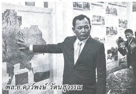
พล.อ.ดาว์พงษ์ รัตนสุวรรณ