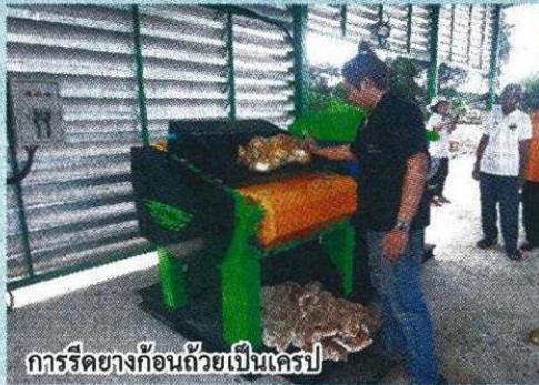
การรีดยางก้อนถ้วยเป็นเครป

ยางเครปทุกชนิดกล่าวถึงเครื่องรีดยางเครป ซึ่งนำมาติดตั้งให้สหกรณ์กองทุนสวนยางดอนหว่า เพื่อเพิ่มทางเลือกให้เกษตรกรชาวสวนยางในการเพิ่มมูลค่าผลิตภัณฑ์ยางก้อนถ้วยเป็นยางเครป โดยบริษัทจะเข้ามาดูแลสหกรณ์อย่างครบวงจร ตั้งแต่การติดตั้งเครื่องรีดยางเครป ออกแบบ