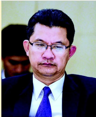
• ธีรภัทร us:ยูรสัทธิ

"จากที่ได้โยกย้ายข้ามกระทรวง จากอธิบดีกรมป่าไม้มารับตำแหน่งเป็นปลัดกระทรวงเกษตรและสหกรณ์นั้น มอง