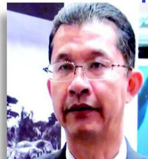
ธีรภัทร ประยูรสิทธิ

เพราะว่าเป็นปลัดกระทรวงเกษตรและสหกรณ์คนปัจจุบัน ก็เลยต้องรับเผือกร้อนกรณีปัญหาราคายางพาราตกต่ำไปเต็มๆ จึงต้องออกมายืนยันว่า ยังไงก็ จะไม่ชดเชย หรือแทรกแซงราคายาง เพราะอาจขัดกับกฎขององค์การการค้าโลก ทาง เครือข่ายสถาบันเกษตรกรชาวสวนยาง 14 จังหวัดภาคใต้ จึงบอกว่า จะนัดรวมตัวกันเคลื่อนไหว เรียกร้องให้รัฐบาล ชดเชยราคายาง ที่ โลกรั้มละ 65 บาท เพราะเวลานี้เดือดร้อนสาหัส ราคาอย่างตกต่ำมาตลอดช่วง 3-4 ปีนี้ ราคาในท้องถิ่นเกษตรกรขายได้แค่ โลกรั้มละ 30 กว่าบาท เลยอยากให้มี กตุ ใช้ ม.44 แก้ปัญหา... สงสัย ม.44 เป็นยาสารพัดโรคจริงๆ ■