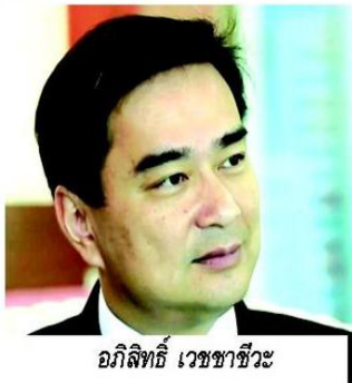
อภิสิทธิ์ เวชชาชีวะ