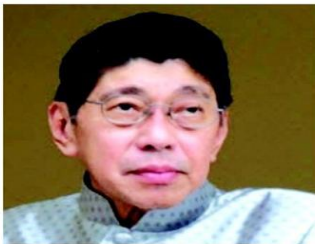
วิชญ์ เครืองาม

คนคนนี้เป็นรองนายกรัฐมนตรีในรัฐบาลปัจจุบัน ได้ตอบสื่อกรณีที่มีเสียงเรียกร้อง ให้จัดการกับโครงการในรัฐบาลอื่นที่ขาดทุน เหมือนกับไล่บี้โครงการรับจำนำข้าวบ้าง ไม่ว่าจะ เป็นโครงการรับประกันราคาข้าวในรัฐบาลอภิสิทธิ์ เวชชาชีวะ หรือการขายยางพาราแบบจืดจูกับประเทศจีนของรัฐบาลนี้ คำตอบที่ออกมาจากปากก็คือ ที่ต้องดำเนินการกับผู้เกี่ยวข้องในโครงการรับจำนำข้าว เพราะ ป.ป.ช. ส่งเรื่องมา ส่วนเรื่องอื่นๆ ป.ป.ช. ไม่ได้ส่งมาให้รัฐบาลดำเนินการ แล้วรัฐบาลจะไปยกขึ้นมาไล่บี้ ก็ไม่รู้จะไปตั้งต้นจากตรงไหน... อินซี้ให้ ป.ป.ช. ไปเต็มๆ ว่าแต่ ป.ป.ช. ละรู้สึกว่าคุณเองหมิ่นบ้างไหม ■