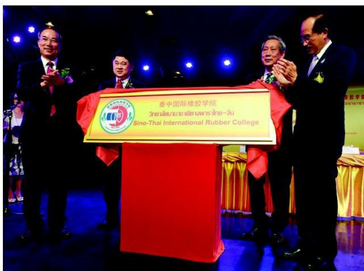
เปิดวิทยาลัยนานาชาติยางพาราไทย-จีน

เป็นไปอย่างราบรื่น ตรงตามนโยบายของทั้ง 2 ประเทศ ทั้งตามนโยบายของภาครัฐ และตรงตามความต้องการของภาคเอกชนที่อยากให้อย่างพาราในประเทศไทยมีความเป็นอุตสาหกรรมมากขึ้น สอดคล้องกับการจัดตั้งวิทยาลัยนานาชาติยางพาราไทย-จีน ที่มีเป้าหมายเพื่อผลิตบุคคลเข้าสู่ภาคอุตสาหกรรมยางพารา โดยหลักสูตรปริญญาตรีจะแบ่งเป็น 3 คณะ แต่ละคณะจะมีนักศึกษา 100 คน รวมจะผลิตบุคลากรที่มีความรู้เรื่องยางพาราและระบบเครื่องจักรกลที่ใช้ในอุตสาหกรรมยางพาราปีละ 300 คน และหลักสูตรปริญญาโท 100 คนต่อปี ส่วนเนื้อหาที่ใช้เรียนจะจัดตามความต้องการของอุตสาหกรรมยางพาราด้วย