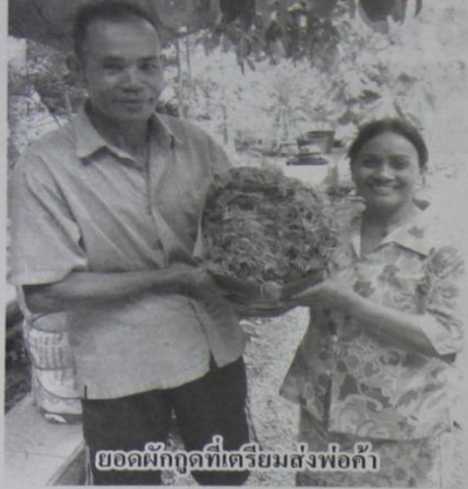
ยอดผักกูดที่เตรียมส่งพ่อค้า