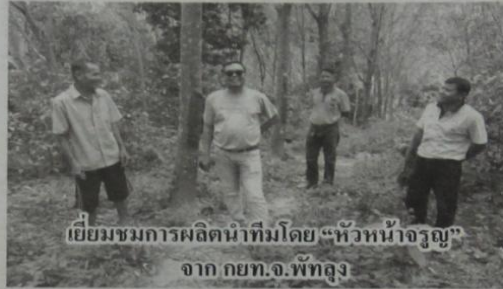
เยี่ยมชมการผลิตน้ำดื่มโดย "หัวหน้าจรูญ" จาก กยท.จ.พัทลุง

ลูงหมาย ยังเล่าให้ฟังต่ออีกว่าความที่ตนเองนั้นชอบทำเกษตรแบบผสมผสาน และเน้นใช้ปุ๋ยอินทรีย์ (ปุ๋ยคอกหรือปุ๋ยมูลสัตว์) มากกว่าเคมี ซึ่งก่อนหน้านี้ก็จะมีค่าใช้จ่ายในการซื้อปุ๋ยซีไ้โกมาใช้ต่อเดือน 2-3 คันรถ นับว่าน่าเสียดายเงินที่ต้องจ่ายไปอยู่เหมือนกัน (รู้สึกเจ็บใจ!) ก็เลยคิดหาวิธีการลดต้นทุน โดยการเลี้ยง "ไก่ไข่" พร้อมสร้างโรงเรือนแบบง่ายๆ อยู่ในบริเวณสวนยางซะเลย! ปรากฏว่าได้ผลช่วยให้ลดค่าปุ๋ยไปได้มาก (2-3 เดือนจึงสั่งซื้อที) จากแม่ไก่ที่เลี้ยงคราวละ 200 แม่/รุ่น และแถมยังได้ไข่ไก่ไว้บริโภคเองเหลือก็ขายเป็นรายได้ให้อีก ส่วนผักกูดยิ่งไม่ต้องห่วงเลยจะหมักซีไ้โกไข่ทำเป็น "ปุ๋ยหมัก" ตามสูตรของกรมพัฒนาที่ดิน ใช้เวลา 15 วัน-1 เดือนแล้วแต่ ก็นำไปใช้หว่านลงในแปลงทุกครั้งหลังจากการ