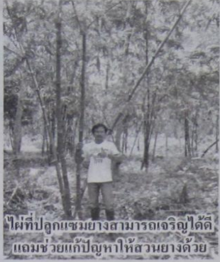
ไม้ที่ปลูกแซมยางสามารถเจริญได้ดี แล้วยังช่วยแก้ปัญหาให้สวนยางด้วย