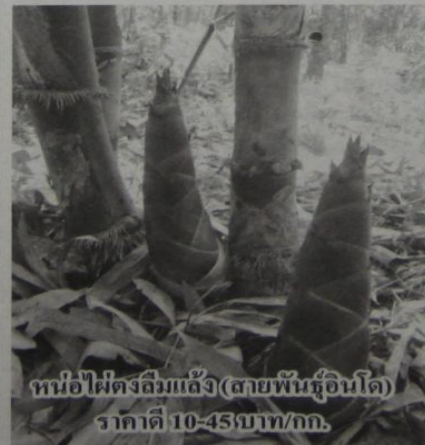
หน่อไผ่ตงลิ้มแล้ง (สายพันธุ์อินโด) ราคาดี 10-45บาท/กก.