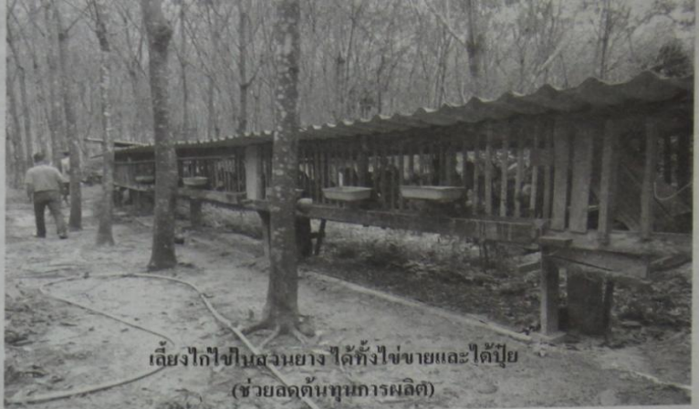
เลี้ยงไก่ป็นสวนยาง ไล่ทั้งไข่ขายและได้ปุ๋ย (ช่วยลดต้นทุนการผลิต)

เป็นพื้นที่กว่า 3 ไร่ ทว่าผักกูดจะค่อนข้างต้องการแสงแดดจึงปลูกร่วมกับสวนยางได้ในช่วง 1-4 ปีแรกจะดี สำคัญอีกอย่างคือ การให้น้ำจะต้องไม่ขาด (เปิดสปริงเกลอร์ให้ชุ่มชื้นอยู่ตลอด) และชอบปุ๋ยอินทรีย์/ปุ๋ยหมักมากกว่าปุ๋ยเคมี ต้นจะงามและให้ "ยอดอวบ" สามารถเก็บขายได้แบบไม่มีการหยุดเลย