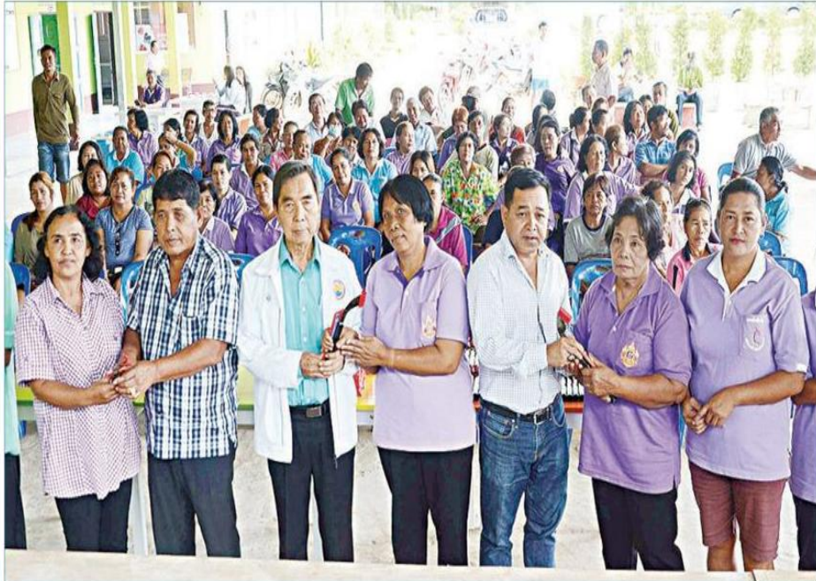
☑️ สอนเทคนิค...กิจ หลีกภัย นายก อบจ.ตรัง เปิดการฝึกอบรมหลักสูตรเทคนิคการลับมีดกรีด ยางพารา รุ่นที่ 1 ประจำปีงบประมาณ 2559 ซึ่งนอกจากความรู้และเทคนิคต่าง ๆ แล้ว ยังได้รับมีด กรีดยาง และหินลับมีดคนละ 1 ชุด เพื่อนำไปฝึกปฏิบัติจริง ที่โรงเรียนบ้านยวนไ้ปะ ต.บางด้วน อ.ปะเหลียน