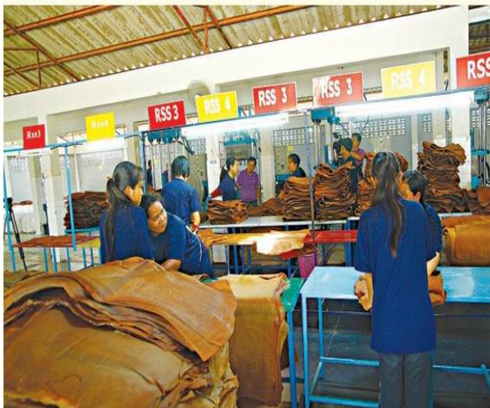
การคัดแยกยางแผ่นตามคุณภาพ