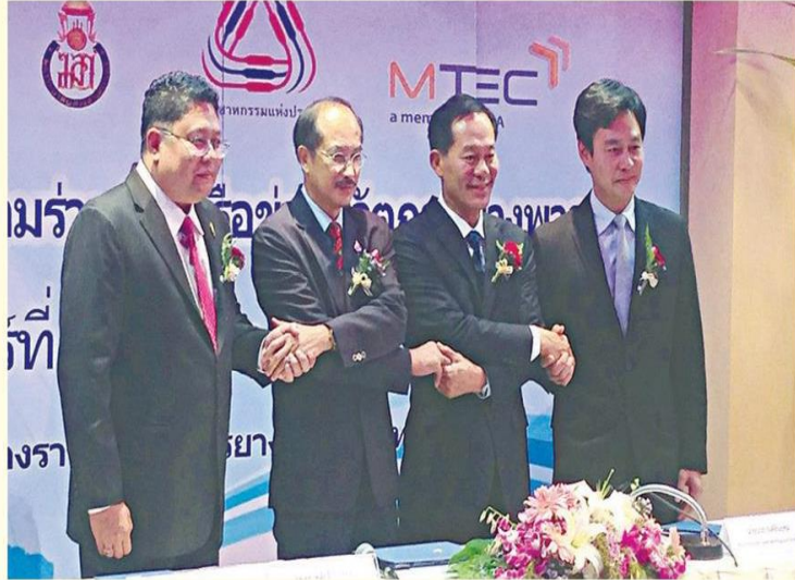
ร่วมลงนามความร่วมมือ

ตามที่รัฐบาลได้กำหนดนโยบายและมาตรการต่าง ๆ ให้ความช่วยเหลือเกษตรกรเพื่อบรรเทาความเดือดร้อนที่เกิดขึ้นโดยได้ดำเนินโครงการสำคัญ ๆ โดยเฉพาะโครงการสร้างความเข้มแข็งให้แก่เกษตรกรชาวสวนยาง โดยจ่ายเงินช่วยเหลือให้ทั้งเจ้าของสวนยางหรือผู้เช่าสวนยาง และคนกรีดยาง ที่มี