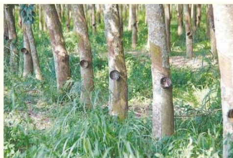
สวนยางพารา

นามบันทึกข้อตกลงความร่วมมือเครือข่ายนวัตกรรมยางพาราอีกด้วย ซึ่งจะมีส่วนสำคัญที่จะเพิ่มปริมาณการใช้ยางในประเทศ และสร้างความเข้มแข็ง เพิ่มขีดความสามารถในการแข่งขันให้กับยางพาราของไทย ตั้งแต่ต้นน้ำ กลางน้ำ และปลายน้ำ ผลักดันให้ประเทศไทยเป็นผู้นำด้านอุตสาหกรรมยางพาราของภูมิภาคและของโลกอย่างแท้จริง