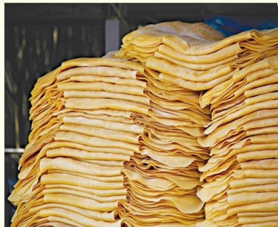
ยางแผ่นคุณภาพ

สวนยางเปิดกรีดยางแล้วในอัตราไร่ละ 1,500 บาท ไม่นเกินกว่า 15 ไร่