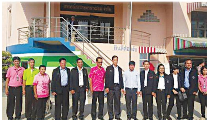
ศึกษาดูงาน

การเกษตรบางกล้า จำกัด สหกรณ์การเกษตร เพื่อการตลาดลูกค้า อ.ก.ส. สงขลา จำกัด และ สหกรณ์น้ำยางไทย จำกัด จะร่วมกันจัดตั้งเป็น ชุมนุมสหกรณ์แปรรูปยางพาราสงขลา จำกัด ใน เขตอุตสาหกรรมเมืองยาง หรือ Rubber City ขึ้น เพื่อเป็นฐานการผลิตและแปรรูปยางพารา ของจังหวัดสงขลา