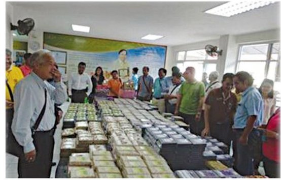
เปิดตลาดมาเลเซีย