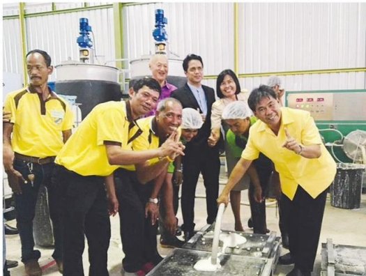
ร่วมเปิดโรงงานผลิตหมอนจากยางพารา

และที่นอนยางพารา ทั้งนี้ สหกรณ์ฯ ได้รับซื้อน้ำยางพาราจากสมาชิกมาแปรรูปเพื่อสร้างมูลค่าเพิ่ม