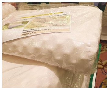
หมอนยางพาราพร้อมวางจำหน่าย

เป็นผลิตภัณฑ์หมอนยางพารา และสามารถช่วยแก้ไขปัญหาราคายางพาราตกต่ำได้อีกทางหนึ่ง ส่งผลต่อการสร้างความเข้มแข็งให้กับสมาชิกสหกรณ์ และสหกรณ์กองทุนสวนยางบ้านหนองครก จำกัด ได้มีโอกาสพัฒนาความก้าวหน้าทางธุรกิจอุตสาหกรรมยาง และเรียนรู้เพื่อพัฒนาผลิตภัณฑ์ยางพาราให้เป็นสินค้าในรูปแบบต่าง ๆ ตามที่ตลาดต้องการมาอย่างต่อเนื่อง