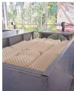
เครื่องเป่าแห้ง