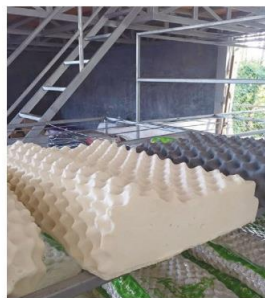
เป็นหมอนคุณภาพเหมาะสมทุกวัย