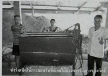
ทำร่วมกับการของรับซื้อถั่วอินจาพารา วัสดุเพาะเห็ดที่ 1

โทร. 085-740-1139 ก็ได้เล่าให้ฟังด้วยว่า เริ่มทำอาชีพเพาะเห็ดมาตั้งแต่ปี พ.ศ. 2540 พร้อมกับเพื่อนบ้านในละแวกอีกหลายคน จนมาถึงในปี 2551-2552 ก็ได้เพิ่มอาชีพใหม่อีกคือทำสวนยางตามการส่งเสริมของหน่วยงานภาครัฐ และตั้งแต่นั้นก็ทำควบคู่กันมาเรื่อยโดยในส่วนของ การเพาะเห็ดจะมีทำประจำอยู่ 4 ชนิด คือ เห็ดบด (หรือเห็ดลม/เห็ดกระด้าง) เห็ดขอนขาว เห็ดนางฟ้า และเห็ดนางรม (หรือเห็ด อังการีขาว) ซึ่งตนเองมีโรงเพาะเลี้ยงอยู่ 5 โรงใช้หมุนเวียนกันผลิต ขนาดความจุก้อน เชื้อ 8,000 ก้อน/โรง รวมทั้งยังมีการผลิต "ก้อนเชื้อเห็ด" เพื่อจำหน่ายราคาส่งให้กับ ฟาร์มและผู้สนใจทั่วไปด้วย ทั้งนี้จะมีการ ใช้เชื้อเลี้ยงไม้ยางพาราเพื่อเป็นวัตถุดิบ (วัสดุเพาะ) อยู่เรื่อยๆ บางช่วงใช้มากก็ต้อง สั่งซื้อบ่อยขึ้น บางช่วงก็ใช้น้อย ซึ่งในการ สั่งซื้อต่อครั้ง 1 คันรถ (12 ตัน) จะมีต้นทุน อยู่ประมาณ 24,000 บาทบวกค่าขนส่ง แล้ว ใช้บรรจุอัดก้อนเชื้อเห็ดได้ราว 18,000 ก้อน ขายส่งในราคา 8 บาท/ก้อน โดยทั่วไปอายุการใช้งานของก้อนเชื้อเห็ด หลังการเปิดดอกแล้วจะอยู่ได้ราว 4-6 เดือน หรือขึ้นอยู่กับการดูแล หากได้วัสดุเชื้อ เลี้ยงที่มีคุณภาพดี ละเอียด จะช่วยให้