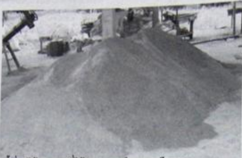
ซีเลียมไม่ย่างพาราที่ได้จากกระบวนการความละเอียดสูง