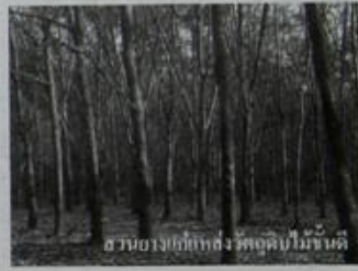
สวนยางที่กักตุนผลผลิตไม้ขี้เหล็ก

ด้านช่องทาง การจัดจำหน่าย โดยเปิดจุดรวบรวมกลางให้เพื่อนำผลผลิตมาขายภายใต้ระบบการประมูลยางที่มีความเป็นธรรม มีการอ้างอิงราคาตามตลาดกลางยางพาราที่เชื่อถือได้ แต่เนื่องด้วยสถานการณ์ราคายางมีความเปลี่ยนแปลงไปตามภาวะการณ์ทางเศรษฐกิจโลกที่เกิดขึ้น ส่งผลโดยตรงต่อรายได้ของชาวสวนยาง คือ ราคายางก้อนถ้วยล่าสุดรับซื้ออยู่ที่ 24-25 บาท/กก. (DRC 55-65) ซึ่งสำหรับกรณีรายย่อยที่ไม่มีการจ้างกรีดยางจะสามารถอยู่ได้ หรือหากเกษตรกรปรับตัวมาทำอาชีพเสริมเพิ่มรายได้ก็อีกทาง เช่น การปลูกพืชร่วมยาง อย่างสับปะรด ในสวนยางอายุ 1-3 ปีแรก ก็พบว่าได้ผลดีราคาดี (3 กก.ต่อ 100 บาท) หรือการปลูกพืชแซม ที่นิยมนิยมปลูกหน่อไม้ฝรั่ง ซึ่งก็สามารถสร้างรายได้เพื่อชดเชยกันในขณะนี้ เป็นต้น รวมทั้งมีอีกตัวอย่างอาชีพที่ได้จากสวนยางพาราโดยเฉพาะ "ไม้อย่างพารา" ก็คือ