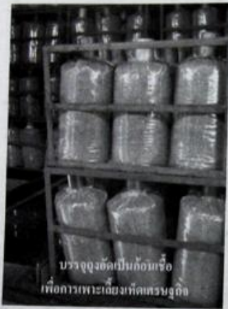
บรรจุจุดจัดเป็นก้อนเชื้อ เพื่อการเพาะเลี้ยงที่ลดทรนุกกิจ

โค้นเพื่อปลูกใหม่ทดแทน อีกทั้งการได้แนวความคิดมาจากเพื่อนบ้านที่ประกอบอาชีพเพาะเห็ดเศรษฐกิจ (หรือเห็ดถุง) ซึ่งมาขอ "ซีเลียมไม่ย่างพารา" ที่เหลือจากการทำเฟอร์นิเจอร์ เพื่อไปทดลองใช้เพาะเห็ด แล้วปรากฏว่าได้ผลดีมากมีการร้องขอให้ผลิตซีเลียมเพาะเห็ดสำหรับส่งขายให้ด้วย จากจุดเริ่มต้นที่เป็นความต้องการใช้ของคนในพื้นที่ ได้นำมาสู่การคิดค้นคิดแปลงในการผลิตเครื่องบดขยอยไม้ (ทำซีเลียมเพาะเห็ด) จนสำเร็จ มีการรับออเดอร์จากกลุ่มลูกค้าฟาร์มเห็ดเพื่อผลิตส่งให้ต่อเนื่องมากกว่าปีแล้ว