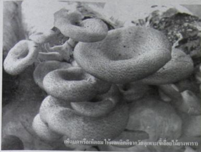
เห็ดบดหรือเห็ดลม ไข่ผสมเกลือจากวัสดุเพาะ(ซึ่งคือไม้ยางพารา)

โทร. 085-740-1139 ก็ได้เล่าให้ฟังด้วยว่า เริ่มทำอาชีพเพาะเห็ดมาตั้งแต่ปี พ.ศ. 2540 พร้อมกับเพื่อนบ้านในละแวกอีกหลายคน จนมาถึงในปี 2551-2552 ก็ได้เพิ่มอาชีพใหม่อีกคือทำสวนยางตามการส่งเสริมของหน่วยงานภาครัฐ และตั้งแต่นั้นก็ทำควบคู่กันมาเรื่อยโดยในส่วนของ การเพาะเห็ดจะมีทำประจำอยู่ 4 ชนิด คือ เห็ดบด (หรือเห็ดลม/เห็ดกระด้าง) เห็ดขอนขาว เห็ดนางฟ้า และเห็ดนางรม (หรือเห็ด อังการีขาว) ซึ่งตนเองมีโรงเพาะเลี้ยงอยู่ 5 โรงใช้หมุนเวียนกันผลิต ขนาดความจุก้อน เชื้อ 8,000 ก้อน/โรง รวมทั้งยังมีการผลิต "ก้อนเชื้อเห็ด" เพื่อจำหน่ายราคาส่งให้กับ ฟาร์มและผู้สนใจทั่วไปด้วย ทั้งนี้จะมีการ ใช้เชื้อเลี้ยงไม้ยางพาราเพื่อเป็นวัตถุดิบ (วัสดุเพาะ) อยู่เรื่อยๆ บางช่วงใช้มากก็ต้อง สั่งซื้อบ่อยขึ้น บางช่วงก็ใช้น้อย ซึ่งในการ สั่งซื้อต่อครั้ง 1 คันรถ (12 ตัน) จะมีต้นทุน อยู่ประมาณ 24,000 บาทบวกค่าขนส่ง แล้ว ใช้บรรจุอัดก้อนเชื้อเห็ดได้ราว 18,000 ก้อน ขายส่งในราคา 8 บาท/ก้อน โดยทั่วไปอายุการใช้งานของก้อนเชื้อเห็ด หลังการเปิดดอกแล้วจะอยู่ได้ราว 4-6 เดือน หรือขึ้นอยู่กับการดูแล หากได้วัสดุเชื้อ เลี้ยงที่มีคุณภาพดี ละเอียด จะช่วยให้