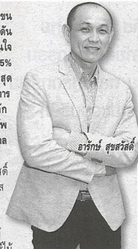
อารั้บ สุขลั้บวั้ลดี

"อีก 2 วันเราจะพรุกชุมแผนการทำงานในปีหน้า เบื่บงต้นรามึ้บแผนทั้บจะขยายไปทั้บต่างประเทศและในประเทศ โดยต่างประเทศ เราจะขยายฐานลั้บคูลักค่าไปในกลุ่มประเทศอาเซีเยนหรือ AEC เพราะประเทศอื่บๆ ยงไม่มีแนวโนม์ในการเติบโตมาก แต่ประเทศ AEC จะมีการลงทุนจากประเทศอื่บๆ ค่อนข้างสูง ดั้บนั้นเราจะเห็นการขนส่งลั้บคูลักค่าไปขายใน AEC