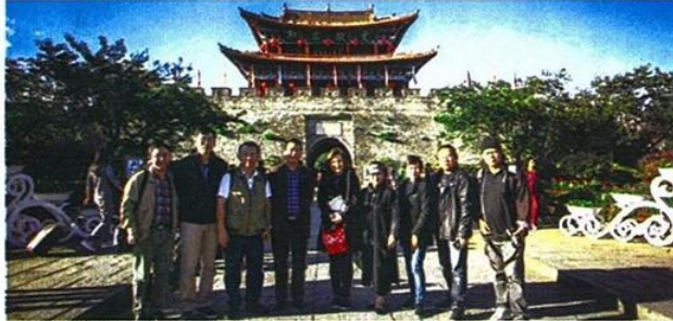
• คณะสื่อมวลชนไทย

หัวข้อข่าว: รายงาน: 'ยูนิทาน' เมืองหน้าด่าน (จีน) สู่อาเซียน