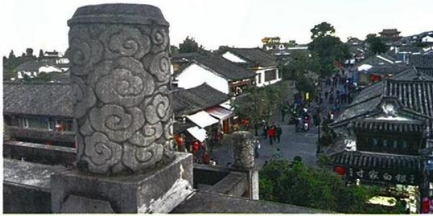
• ดาหลี่ เมืองโบราณศูนย์กลางของอาณาจักรบ้านเจ้าใบอดีต

เช่น กุ้ยโจว เสฉวน ฉงชิ่ง กวางโจว บักกิง เชียงไฮ้ ทิเบต ส่วนทางตะวันออกของประเทศมี 5 เส้นทาง เชื่อมสู่เอเชียใต้ และอาเซียน โดยเส้นทางที่จะเชื่อมสู่ลาว ถึงไทยคือ คุณหมิง-บ่อหาน อีก 4 เส้นทางจะมุ่งสู่เมียนมา เวียดนาม และอินเดียนอกจากทางตะวันออกของประเทศ