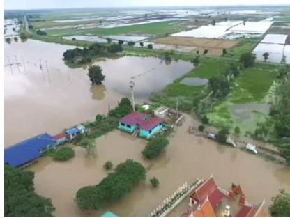
น้ำท่วมในจังหวัดภาคใต้

น้ำท่วมในภาคใต้สร้างความเสียหายให้สวนยางพารา 1 ล้านไร่ มูลค่า 40,000 ล้านบาท ขณะที่กระทรวงเกษตรและสหกรณ์ประเมินความเสียหายภาคการเกษตรเกือบแสนล้านบาท คลังตั้งธนาคารรัฐทำซอฟท์โลน 0 %