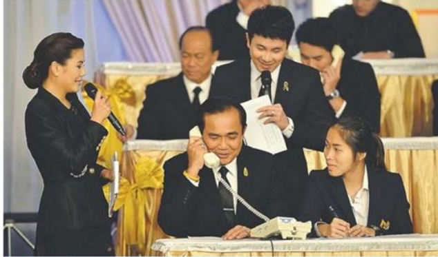
■ รับสายบริจาค ■ พล.อ.ประยุทธ์ จันทร์โอชา นายกรัฐมนตรี ร่วมรับโทรศัพท์จากผู้โทรเข้ามาบริจาคในรายการ “ประชารัฐร่วมใจ ช่วยอุทกภัยภาคใต้” โดยนักร้อง “น้องเมย์” รัชก อินทนนท์ นักแบดมินตันทีมชาติไทย เมื่อวันที่ 15 ม.ค.

หัวข้อข่าว: บิ๊กบูป्लीมน้ำใจคนไทยช่วยน้ำท่วมใต้ 2 ชั่วโมง 300 ล.