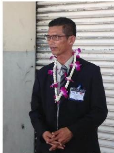
ประธานสหกรณ์กองทุนสวนยางบ้านดอนหอย จ.อ.

ศูนย์ข่าวศรีราชา - สหกรณ์กองทุนสวนยางบ้านดอนหอย จำกัด จ.อุดรธานี ร่วมการยางแห่งประเทศไทย ส่งออกยางพาราอัดแท่งให้บริษัทเอกชนของจีน ซึ่งได้รับสัมปทานจากกองทัพให้ดูแลเกี่ยวกับอุตสาหกรรมทางการทหาร โดยทำพิธีส่งออกล็อตแรก 600 ตัน ที่ท่าเรือแหลมฉบัง จ.ชลบุรี