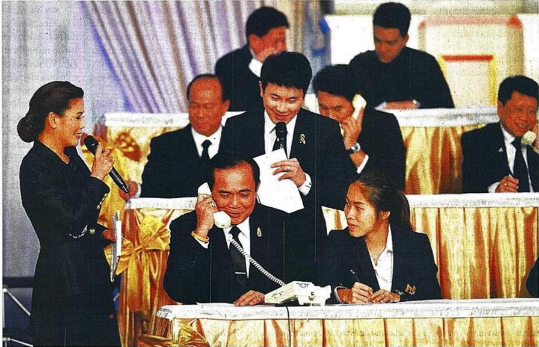
ช่วยนำท่วม : พล.อ.ประยุทธ์ จันทร์โอชา นายกรัฐมนตรี เป็นประธานรับมอบเงินช่วยเหลือผู้ประสบอุทกภัยภาคใต้ และร่วมรับโทรศัพท์จากผู้บริจาค โดยนั่งคู่กับ น้องเมย์ รัชชก อินทนนท์ ในรายการพิเศษ "ประชารัฐร่วมใจ ช่วยอุทกภัยภาคใต้" ณ ดิกลันดิโมเดิร์น ทำเนียบรัฐบาล วานนี้ (15 ม.ค.)