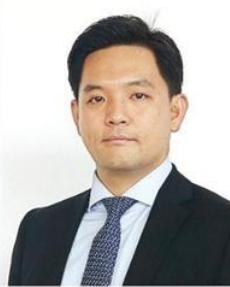
เจิน ฑูเซ็ง (โทนี่ เจิน)