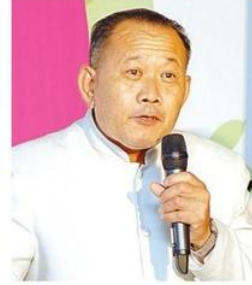
นิพนธ์ คนขยัน