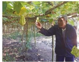
ไม่ลงทุนเกินความสามารถ