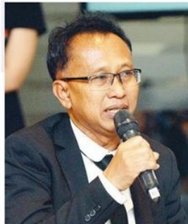
เชาว์ ทรงอาวุธ

พินิจบอกว่า เนื่องจากประเทศไทยเป็นผู้ผลิตอันดับ หนึ่งทางงานวันยางพาราจึงมีผลต่อตลาดโลก โดยเฉพาะ ตลาดประเทศจีนที่เป็นผู้ซื้อยางพารามากที่สุดในโลก ซึ่งงานในปีนี้จะมีการพัฒนา