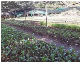
มีผลผลิตส่งขายได้ต่อเนื่อง