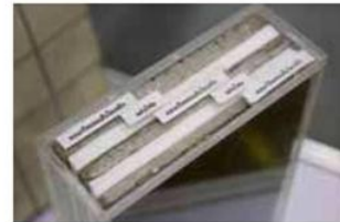
นักศึกษานิเทศศาสตร์ มจร. พัฒนาผนังคอนกรีตกันกระสุนหวังใช้เป็นบังเกอร์ทางเลือกแทนกระสอบทราย