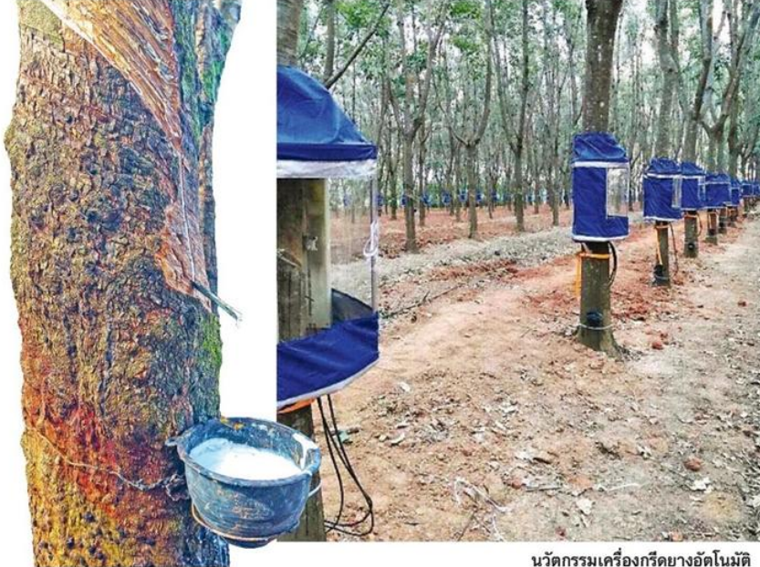
นวัตกรรมเครื่องกรีดยางอัตโนมัติ

หัวข้อข่าว: งานวันยางพาราและกาชาดบึงกาฬ 60 ยกระดับนวัตกรรม 'บึงกาฬ 4.0'