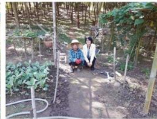
เจ้าหน้าที่กับเกษตรกร