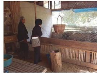
เลี้ยงไก่แบบระบบปิด

เกษตรกรครอบครัวนี้ประสบความสำเร็จในการทำกิน ด้วยไม่มีหนี้สินค้าง ขณะที่สามารถขยายกิจการด้านการเพาะปลูกเพื่อเพิ่มรายได้ให้กับครอบครัวเพิ่มขึ้น โดยไม่มีอัตราเสี่ยงต่อรายได้และการลงทุน จึงได้รับการยอมรับจากส่วนงานที่เกี่ยวข้องจัดให้เป็นครอบครัวต้นแบบในการดำรงตนภายใต้การน้อมนำปรัชญาของเศรษฐกิจพอเพียง ศาสตร์ของพระราชฯ มาปฏิบัติใช้ จนประสบความสำเร็จที่เป็นรูปธรรมมีผลงานเชิงประจักษ์อย่างแท้จริง