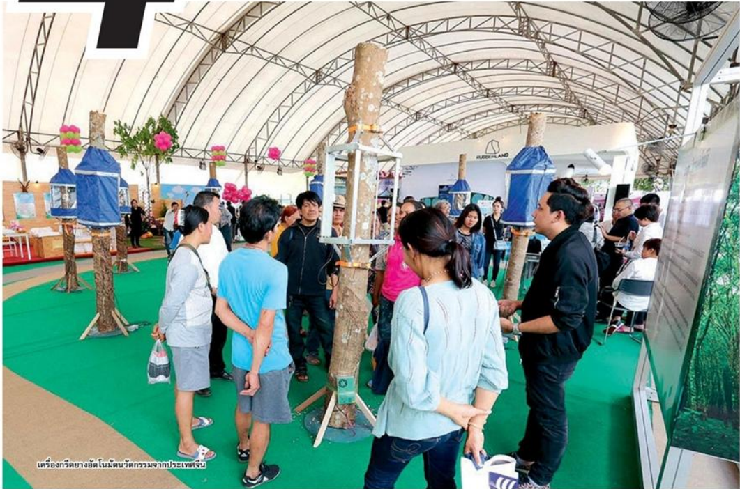
เครื่องรีดยางอัตโนมัตินวัตกรรมจากประเทศไทย

ตามนโยบาย "ไทยแลนด์ 4.0" ของ พล.อ.ประยุทธ์ จันทร์โอชา นายกรัฐมนตรีและหัวหน้าคณะรักษาความสงบแห่งชาติ (คสช.) ที่มุ่งเน้นการปรับเปลี่ยนโครงสร้างเศรษฐกิจไปสู่ "Value-Based Economy" หรือ "เศรษฐกิจที่ขับเคลื่อนด้วยนวัตกรรม" ซึ่งได้รับการตอบรับจากทุกภาคส่วน