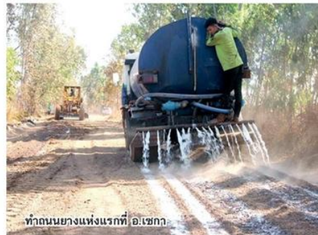
ทำถนนยางแห่งแรกที่ อ.เซกา

ระบุว่า ข้อดีของการทำถนนยางพาราดีนซีเมนต์สามารถดึงพาราในประเทศมาใช้ ส่วนถนนก็สร้างได้โดยไม่ต้องยกและรวดเร็ว วันหนึ่งสามารถทำได้ 500-600 เมตร นอกจากมีต้นทุนที่ถูกลง ยังมีเรื่องของโครงสร้างที่แข็งแรงด้วย