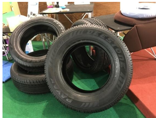
ยางล้อดีสโตน

โดยทั่วไป เกษตรกรนิยมใส่ถุงมือยางสำหรับเก็บยางก้อนถ้วย ระยะเวลาทางโรงงานตรวจสอบพบว่า มีเศษถุงมือยางปนเข้ามาในยางก้อนถ้วย ทำให้ไม่สามารถส่งออกยางก้อนถ้วยได้ เพราะถุงมือยาง ยางรัดของ ฯลฯ ถือเป็นผลิตภัณฑ์ยางตาย ที่ผ่านการแปรรูปมาแล้ว ไม่สามารถผสมในยางแท่งสำหรับผลิตยางล้อรถยนต์ เพราะจะทำให้ยางล้อระเบิดได้