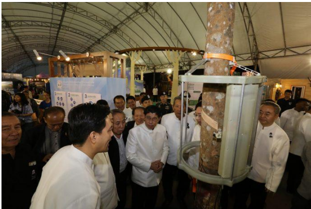
เครื่องกรีดยาง