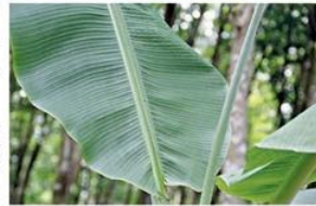
ใบกล้วยป่ามีคุณภาพ

ที่สามารถนำมาใช้ประโยชน์ได้ตลอดทั้งปี โดยหยวกกล้วยนำมาปรุงอาหารได้สารพัด และอร่อยกว่าหยวกกล้วยบ้านชนิดอื่นๆ เพราะจะนิ่มและหวานกว่า โดยแต่ละเอาเปลือกที่แข็งออกให้หมด หั่นเป็นชิ้นเล็กๆ นำมาแกงใส่ไก่ กระดุกหมู หรือปลาแห้ง ยำใส่