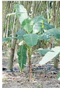
ปลูกแซมในสวนยางพารา

จะตัดใบทองได้ 2 ยอด พื้นที่ปลูก 1 ไร่ ก็จะได้ ใบทอง จำนวน 500 ยอด และมีพ่อค้าเข้ามารับ