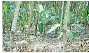
ต้นยางได้ความชื้นจากกล้วยกล้วยได้รับน้ำจากต้นยาง