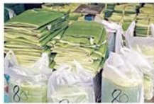
ในประเทศมีความต้องการใบทองเพิ่มขึ้น

ราคาใบทองของไทยจึงขายได้ราคาในต่างประเทศเฉลี่ยยอดละ 100 บาท เพราะมีคุณภาพ