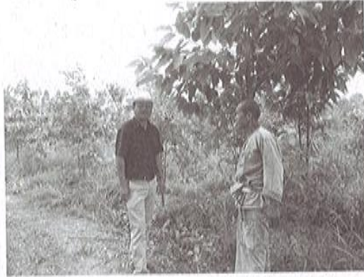
โซนไม้เศรษฐกิจอาทิ ยางนา ถัก ตะเคียนทอง ฯลฯ

ของ "เศรษฐกิจพอเพียง" ที่ว่าด้วยความพอเพียง คือ พอใจ และ "เกษตรทฤษฎีใหม่" ซึ่งมีความพิเศษขึ้นมาอีกคือ คำว่าใหม่ ที่หมายถึงการจัดสรรพื้นที่ (30 : 30 : 30 : 10) สำหรับการทำทุกอย่างให้มีครบ เพื่อตอบโจทย์ทั้งด้านของความเป็นอยู่ อาชีพ และรายได้ อย่างไม่ขาดแคลนหรือเดือดร้อนตามมา ขณะเดียวกันก็ได้ถอดแบบสำหรับการจัดการมาจากอาจารย์ยักษ์ คือ "โคก-หนอง-นาโมเดล" ใช้ในพื้นที่ของตนเอง ที่เริ่มจากในสวนยางจะ