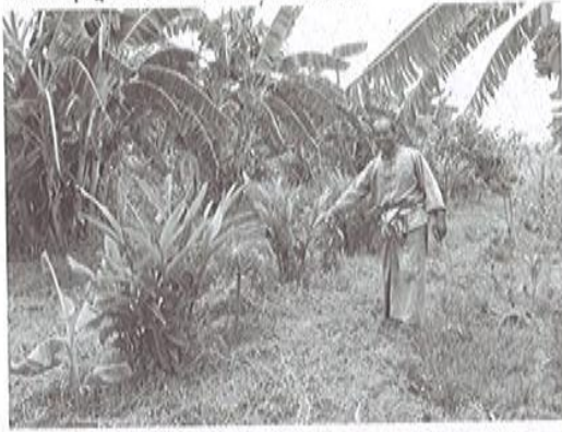
เกษตรทฤษฎีใหม่ (โซนไม้ผล & พืชเศรษฐกิจ)

แม้ว่าราคายางจะขึ้น-ลงบ้าง เกษตรกรก็ยังสามารถพอมีควมคุ้มค่า (ที่อาจจะน้อยลงไป) ซึ่งไม่ทำให้ถึงกับถอดใจเหมือนอย่างเช่นพื้นที่ทางอื่น อย่างในเขต จ.ขอนแก่น เองมีการริเริ่มทำสวนยางมาตั้งแต่ พ.ศ.2532 และต่อมาในปี 2542 ที่เริ่มมีโครงการส่งเสริมฯ จนถึงขณะนี้การปลูกยางจะพบมากที่ อ.กระนวน อ.น้ำพอง และ อ.อุบลรัตน์ นอกนั้นเป็นพื้นที่ทำนาและมียางพาราแทรกอยู่บ้างรวมทั้งจังหวัด 76,000 ไร่ ขึ้นทะเบียนสมาชิกในระบบของ กยท. แล้ว 100% หรือราว 6,000 ราย ซึ่งที่ผ่านมาส่วนหนึ่งมีการดำเนินการเรื่อง "เศรษฐกิจพอเพียง" หรือประกอบอาชีพเสริมเพิ่มรายได้ตามโครงการส่งเสริมจาก กยท. และในครั้งนี้นักภายใต้โครงการเกษตรทฤษฎีใหม่ฯ จะเป็นอีกขั้นที่ช่วยสร้างความมั่นใจว่าการเดินตามแนวทางของในหลวง (รัชกาลที่ 9) นั้น เกษตรกรจะมีภูมิคุ้มกันแข็งแรงขึ้น อย่างชาวสวนยางเองก็จะได้เปลี่ยนมุมมองจากพืชเชิงเดี่ยวสู่การทำเกษตรที่หลากหลาย เพื่อช่วยลดความเสี่ยง และสร้างรายได้ที่ยั่งยืนในที่สุด