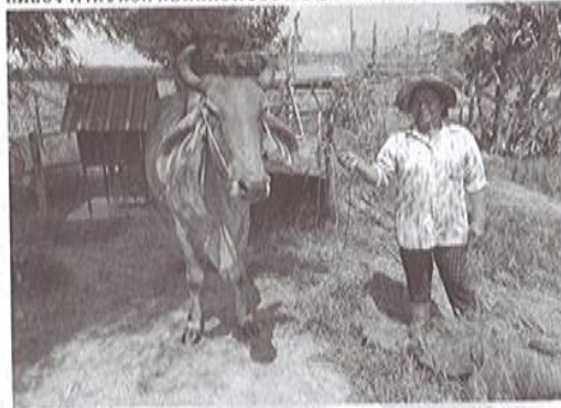
ปลูกพืชผักสร้างเงิน (รายวัน)