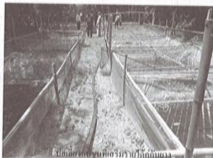
ปศุสัตว์กับสวนที่เสริมรายได้คู่กัน

เกษตรกรรมอย่างพาราเป็นอีกทางเลือกของรายได้ที่เพิ่มขึ้นมาด้วยทางหนึ่ง และยังมีรูปแบบในการบริหารจัดการสวนยางที่เน้นทำเองภายในครัวเรือน มากกว่าจะเป็นระบบจ้าง (เด้าแก่สวนยาง : คนงานรับจ้างกรี๊ด) กอปรกับปัจจุบันที่นิยมขายยางกันในรูปแบบ “ยางก้อนถ้วย” มีโรงงานยางแห้งฯ เปิดรับซื้อโดยตรง ก็เลยทำให้ต้นทุนผลผลิตไม่สูงมากนักและ