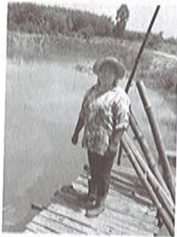
ชุดบ่อน้ำใช้ในถาวรและเอี่ยมปลา