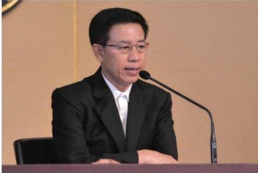
นายกาขอบคุณทุกฝ่ายร่วมมือกันแก้ปัญหาราคายางตกต่ำ ยืนยันรัฐบาลไม่ทิ้งนอนใจ ยกเป็นวาระสำคัญต้องแก้ไขทั้งระบบ

วันนี้ (1ก.ค.60) พล.ท.สรรเสริญ แก้วกำเนิด โฆษกประจำสำนักนายกรัฐมนตรี เปิดเผยว่า พล.อ.ประยุทธ์ จันทร์โอชา นายกรัฐมนตรีและหัวหน้าคณะรักษาความสงบแห่งชาติ (คสช.) ขอบคุนข้อเสนอแนะจากกลุ่มการเมืองและเกษตรกรชาวสวนยางเกี่ยวกับการแก้ไขปัญหาราคายางพาราตกต่ำในช่วงนี้ โดยย้ำว่ารัฐบาลไม่เคยมองนิ่งนอนใจและยกเรื่องนี้เป็นวาระสำคัญที่ต้องทำให้เกิดความยั่งยืนด้วยการแก้ไขทั้งระบบ ไม่ใช่แค่กันที่ปลายทางคือ การให้เงินอุดหนุนอย่างเดียวเหมือนที่ผ่านมา