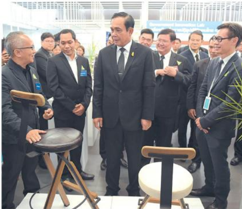
● เข็มชน... พล.อ.ประยุทธ์ จันทร์โอชา นายกรัฐมนตรี และหัวหน้าคณะรักษาความสงบแห่งชาติ (คสช.) พร้อมด้วย นายสุวิทย์ เมธินทร รมช.ประจําสำนักนายกรัฐมนตรี นายทีเชษฐ ชูวงศ์เจริญ รมว.ดิจิทัลเพื่อเศรษฐกิจและสังคม เข็มชนศูนย์สร้างสรรคงานออกแบบ (TCDC) กรุงเทพฯ ซึ่งได้ย้ายที่ทำงานแห่งใหม่ภายในอาคารไประณีตกลาง ถนนเจริญกรุง เขตบางรัก กรุงเทพฯ -