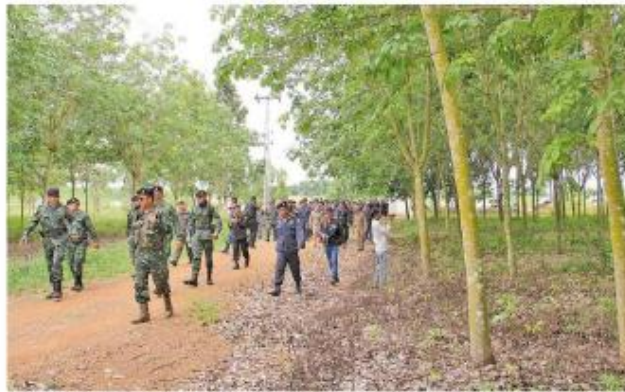
ยึดคืน - เจ้าหน้าที่ป่าไม้สนธิกำลังเข้าตรวจยึดสวนยางพาราเอวาวิน 462 ไร่ หมู่ 9 ต.ต้นธงชัย อ.เมือง จ.ลำปาง บุกรุกป่าสงวนแห่งชาติป่าแม่ต๋ำฝั่งซ้าย หรือป่าเนินต๋ำที่ผู้ครอบครอง ซึ่งเป็นเจ้าของโรงงาน เข้ามามีถือครองของจังหวัด เมื่อวันที่ 30 มิถุนายน