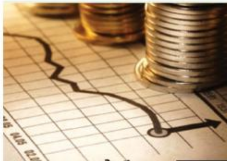
ประมาณการเศรษฐกิจไทยปี 2560 หน่วย: % /ปี

การส่งออก มูลค่าการส่งออกไทยเติบโตอย่างโดดเด่นในช่วง 4 เดือนแรกของปี 2560 จากการส่งออกสินค้าที่เกี่ยวข้องกับราคาน้ำมัน โดยเฉพาะยางพาราและผลิตภัณฑ์ยางพารา อย่างไรก็ตามเราเฝ้าระวังการส่งออกไทยในช่วงที่เหลือของปีจะค่อยๆ ชะลอตัวลง เนื่องจากแรงหนุนทางด้านราคาสินค้าโภคภัณฑ์จะค่อยๆ ผ่อนแรงลง ส่งผลให้การส่งออกในปี 2560 น่าจะขยายตัวได้ 2.5% ดีขึ้นจากปีก่อนหน้าที่ 0.5%