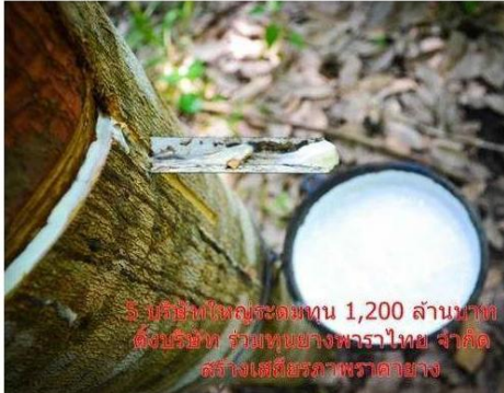
บริษัทยางพาราขนาดใหญ่ 1,200 ล้านบาท ตั้งบริษัท ร่วมทุนยางพาราไทย จำกัด สร้างเสถียรภาพราคาอย่าง

หัวข้อข่าว: TRUBB ลงทุน 200 ล้านบาทร่วมตั้งบริษัทร่วมทุนยางพาราไทย