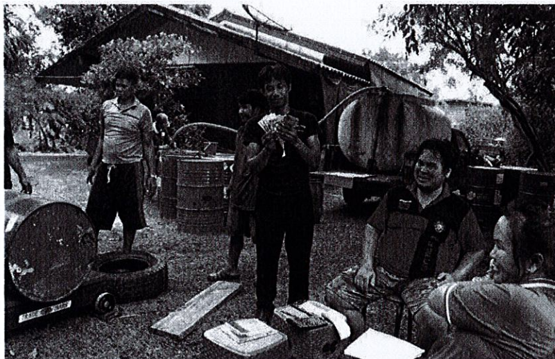
ขายน้ำยาง - สำนักงานประชาสัมพันธ์จังหวัดบึงกาฬ รมรลงค์ให้ชาวสวนยางหันมาขายน้ำยางสดแทนขายขงก้อนด้วยที่บ้านโคกกระแซ หมู่ที่ 8 และหมู่ที่ 12 ต.ลำเจริญ อ.ไชยพิสัย พร้อมสอนวิธีวัดเปอร์เซ็นต์ มีตลาดกลุ่มเริ่มหันมาขายน้ำยางสดมากขึ้นเนื่องจากได้เงินสดทุกวันและไม่ต้องเสี่ยงชีวิตคคกับสารเคมี

ทั้งนี้ จุดรับซื้อน้ำยางพาราสด บ้านโคกกระแซ หมู่ที่ 8 และหมู่ที่ 12 ต.ลำเจริญ อ.ไชยพิสัย เกษตรกรชาวสวนยางพาราร่วมกันจัดตั้งกลุ่มแปลงใหญ่ขงพารา เป็นจุดรวบรวมน้ำยางพาราสดก่อนส่งขายให้กับ โรงงานรับซื้อน้ำยางพารา ไม่ผ่านพ่อค้าคนกลาง เพิ่มรายได้ให้กับเกษตรกร แก้ปัญหาราคาคผลผลิตตกต่ำ