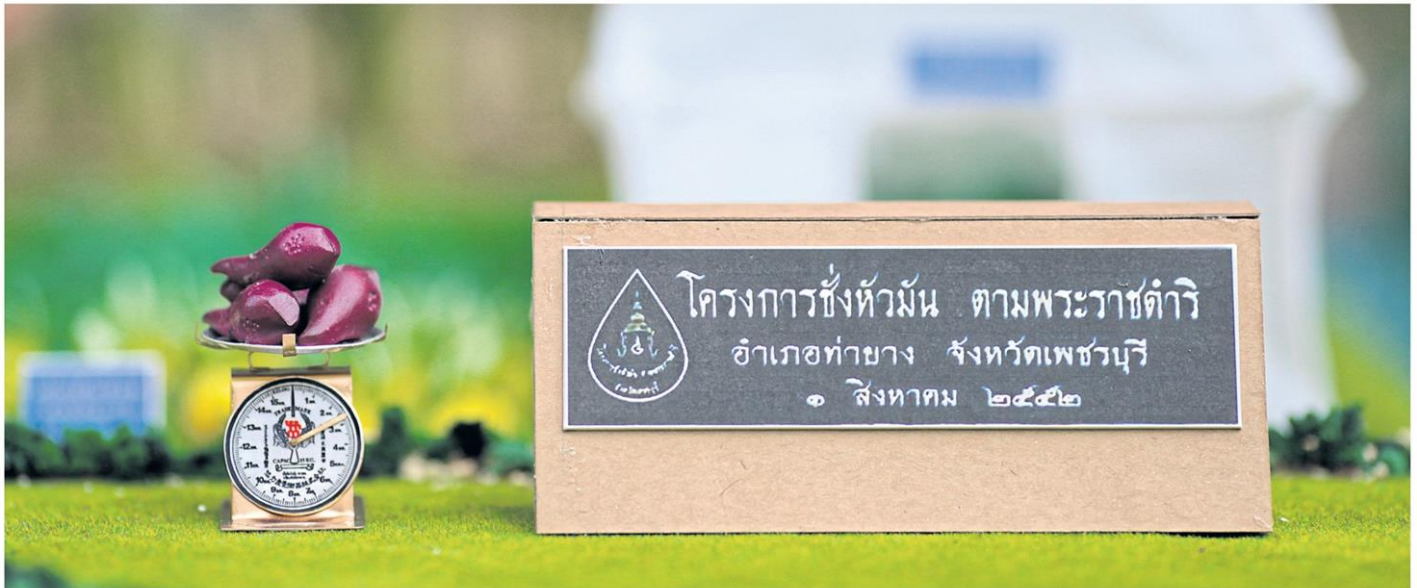
A small model of the late King Bhumibol Adulyadej's initiative Chang Hua Man project. PATIPAT JANTHONG