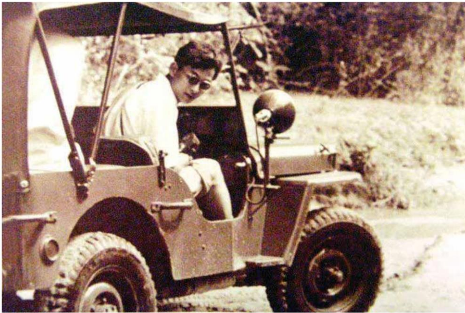
ในหลวงรัชกาลที่ 9 เมื่อครั้งเสด็จพระราชดำเนินถนนสายห้วยมงคล

หลัง พระบาทสมเด็จพระปรมินทรมหาภูมิพลอดุลยเดชทรงขึ้นครองราชย์