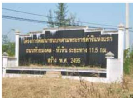
ปี 2525 พระบาทสมเด็จพระเจ้าอยู่หัว

"ให้พิจารณาพื้นที่ที่เหมาะสม จัดทำโครงการพัฒนาด้านอาชีพการประมงและการเกษตรในเขตพื้นที่ชายฝั่งทะเล และจังหวัดจันทบุรี" พร้อมพระราชทานเงินที่ราษฎรจังหวัดจันทบุรีทูลเกล้าฯ ถวายในโอกาสนั้น เป็นทุนเริ่มดำเนินการ ผู้ว่าราชการจังหวัดในขณะนั้นจึงรับสนองพระราชดำริ โดยได้รับความร่วมมือจากหน่วยงานที่เกี่ยวข้อง จัดหาพื้นที่บริเวณอ่าวคุ้งกระเบน ครอบคลุมชายฝั่งทะเลโดยรอบรวม 2,000 ไร่ และพื้นที่ใกล้เคียง ซึ่งเป็นเขตหมู่บ้านประมงตลอดแนวชายฝั่งทะเลกว่า 32,000 ไร่