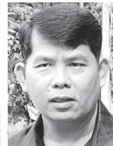
ทรงรัฐ ใจวงษ์