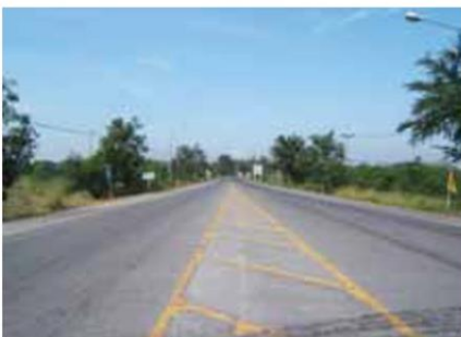
สภาพถนนสายห้วยมงคลในปัจจุบัน

ปัจจุบันศูนย์ศึกษาการพัฒนาอันเนื่องมาจากพระราชดำรินี้มีทั้งหมด 6 ศูนย์ กระจายอยู่ตามภูมิภาคต่างๆ ทั้ง 4 ภูมิภาค เริ่มจากศูนย์ศึกษาการพัฒนาเขาหินซ้อน นับเป็นศูนย์ศึกษาการพัฒนา แห่งแรก ก่อตั้งขึ้นเมื่อวันที่ 8 สิงหาคม 2522 ใน ต.เขาหินซ้อน