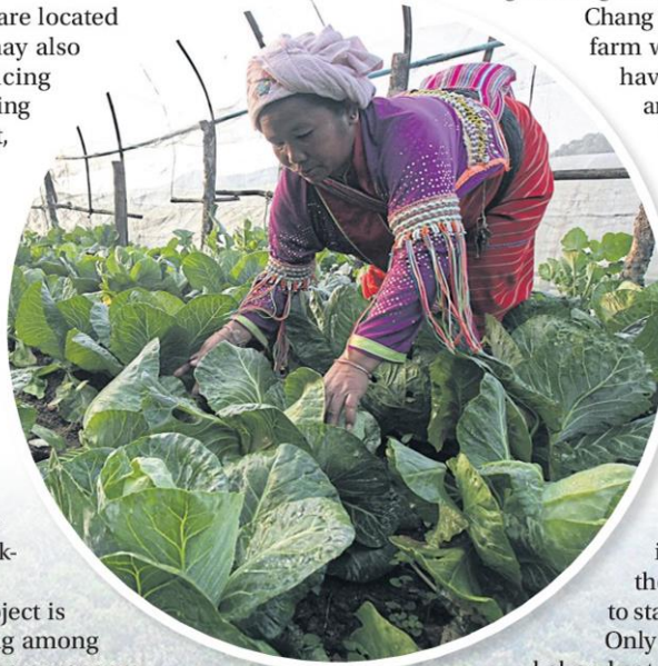
A hilltribe farmer tends a cabbage garden at Doi Angkhang, Chiang Mai. THITI WANNAMONTHA

Only a two-hour drive from Bangkok and not far from other main cities in the South, Chang Hua Man is heavily promoted by many hotels and tour companies. For example, Ban Suan River Resort in Kang Krachan in Prachuap Khiri Khan is offering a two-day group