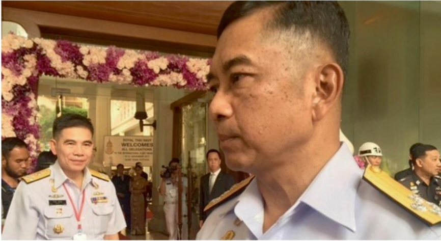
(ซ้าย) พล.ร.อ.ลือชัย รุดดิษฐ์ (ขวา) พล.ร.อ.นริศ ประทุมสุวรรณ

หัวข้อข่าว: รายงานพิเศษ: 'ป่าเปรม' และบ้านสี่เสา ยามเมื่อลมพัดหวาน การเมืองร้อน-