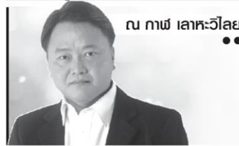
ณ กาฬ เลาะห์วิลัย