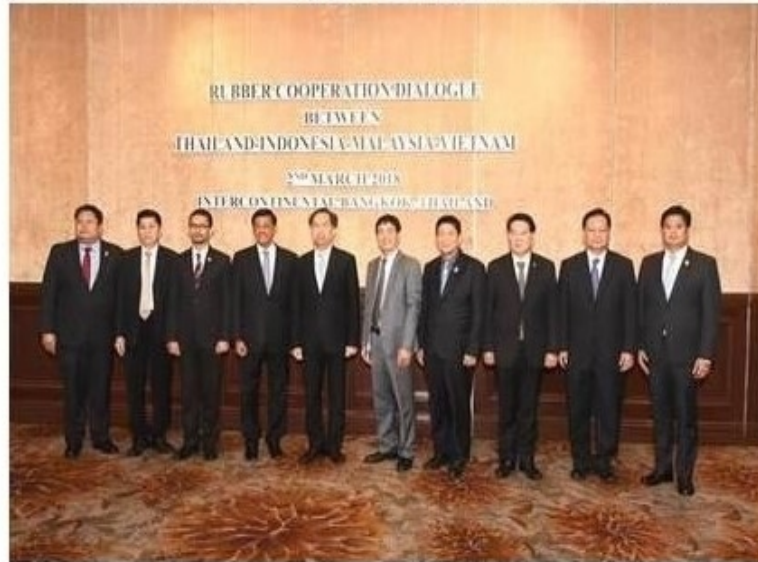
ดูรูปทั้งหมด

ข่าวทั่วไป ThaiPR.net -- ศุกร์ที่ 2 มีนาคม 2561 18:38:30 น.