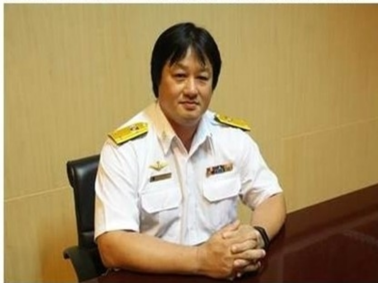
ดูรูปทั้งหมด

ข่าวทั่วไป ThaiPR.net -- อังคารที่ 24 เมษายน 2561 10:28:49 น.