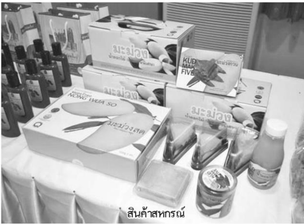
สินค้าสหกรณ์