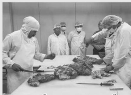
การแปรรูปโคเนื้อของสหกรณ์เครือข่ายโคเนื้อ จ.ก.

นอกจากนี้ สิ่งที่รองนายกรัฐมนตรีได้เน้นย้ำกับสหกรณ์เครือข่ายโคเนื้อคือ อยากให้สหกรณ์