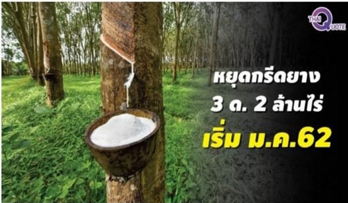
เกษตรกรตอบรับ หยอดกรีดยาง 3 ด.แก้ราคาตกต่ำ

ก.เกษตรฯ เดินหน้าแก้ราคายางตกต่ำ ขยายวงค้ำสต็อกทำพลังงานชีวมวล หรือ เครื่องขยายเกษตรกรหยอดกรีดยาง 2 ล้านไร่ เริ่ม ม.ค.62 ยกระดับราคายางให้เกิน 60 บาทต่อกิโลกรัม