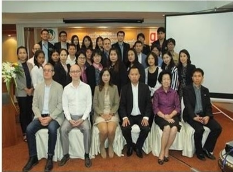
ดูรูปทั้งหมด

ข่าวทั่วไป ThaiPR.net -- อังคารที่ 13 พฤศจิกายน 2561 11:51:18 น.