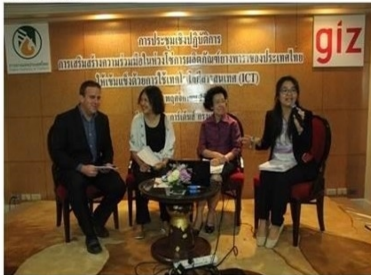
ดูรูปทั้งหมด

ข่าวเศรษฐกิจ สำนักข่าวอินโฟเควสท์ (IQ) -- อังคารที่ 13 พฤศจิกายน 2561 12:15:22 น.