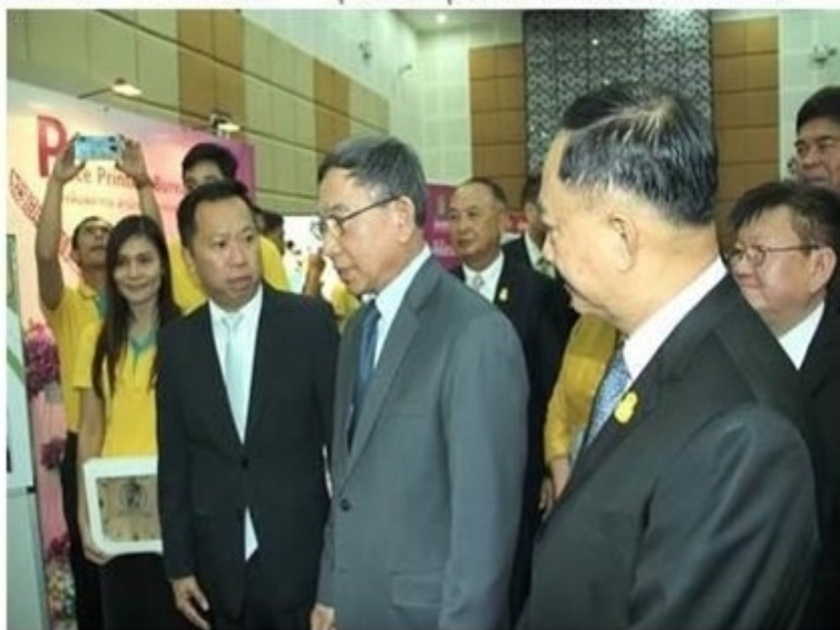
ดูรูปทั้งหมด

ข่าวทั่วไป ThaiPR.net -- พุธที่ 27 กุมภาพันธ์ 2562 17:35:48 น.