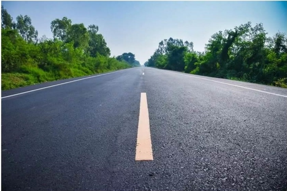
ถนนยางพาราของไทย

เนื่องจากถนนลาดยางพาราเป็นนวัตกรรมงานวิจัยที่ประเทศไทยพัฒนาขึ้นเพื่อสร้างมูลค่าเพิ่มกับยางพารา เพราะประเทศไทยมียางพาราเป็นพืชเศรษฐกิจและผลิตมากที่สุดในโลก ถนนผสมยางพาราได้รับการรับรองมาตรฐานอุตสาหกรรมระดับชาติ ความโดดเด่นของการนำยางพาราผสมเพื่อทำถนนจะเป็นการเพิ่มคุณสมบัติการทนความร้อนได้มากกว่าถนนยางมะตอยปกติ และมีค่าความยืดหยุ่นและคืนตัวดีกว่า มีความแข็งแรงและอายุการใช้งานที่มากกว่า ทำให้เหมาะสมกับประเทศในเขตร้อน โดยในช่วงเข้าการยางแห่งประเทศไทยได้จัดการบรรยายรายละเอียดขั้นตอนการนำยางพารามาทำถนน 2 แบบ ประกอบด้วย 1) ถนนยางพาราซอยด์ซีเมนต์ และ 2) ถนนแอสฟัลต์คอนกรีตปรับปรุงคุณภาพด้วยยางพาราคุณภาพ และในช่วงบ่ายจะมีการลงพื้นที่ศึกษาดูงาน ณ จังหวัดฉะเชิงเทราด้วย