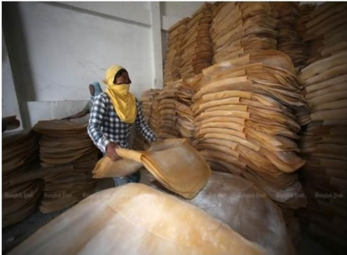
Thailand will cut rubber exports for four months from Monday to shore up prices.