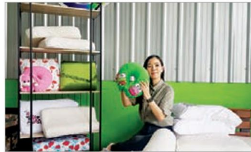
ผลิตภัณฑ์ "ตะลุงลาเท็กซ์" จากน้ำยางพาราชั้น "พาราฟิต"

ก่อนผลิตหมอนและที่นอนยางพาราจะต้องปมน้ำยางพารา ให้กลายเป็นน้ำยางพาราชั้นและกำจัดแอมโมเนียออกจากน้ำยางชั้นให้อยู่ในระดับเหมาะสมก่อน ซึ่งปกติในขั้นตอนการผลิตน้ำยางชั้นนั้นจะใช้เวลานานถึง 21 วัน แต่น้ำยางชั้นพาราฟิตใช้เวลาผลิตเพียง 1-3 วัน เนื่องจากไม่ต้องมีขั้นตอนกำจัดแอมโมเนียออกจากน้ำยางชั้น และยังลดความเสี่ยงน้ำยางน้ำบูดจากการปมที่ใช้เวลาหลายวันด้วย