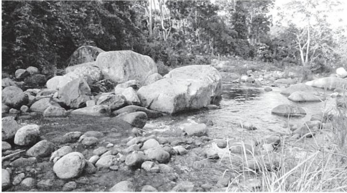
บริเวณคลองวังหีบ พื้นที่เป้าหมายในโครงการก่อสร้างเขื่อนวังหีบ อันเนื่องมาจากพระราชดำริ เพื่อแก้ปัญหาอุทกภัยตามคำเรียกร้องของชาวบ้าน.

หัวข้อข่าว: ความเห็นต่างสร้าง“เขื่อนวังหีบ” ปัญหาหน้าท่วมทุ่งสงเป็นเดิมพัน