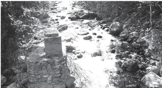
สภาพคลองวังหีบซึ่งรับน้ำมาจาก เขื่อนเขาบรทัด หรือ “เขาเหมน” มีน้ำไหลทั้งปีเชื่อว่าหากมีการสร้างเขื่อนจะสามารถแก้ปัญหาอุทกภัยและภัยแล้ง.