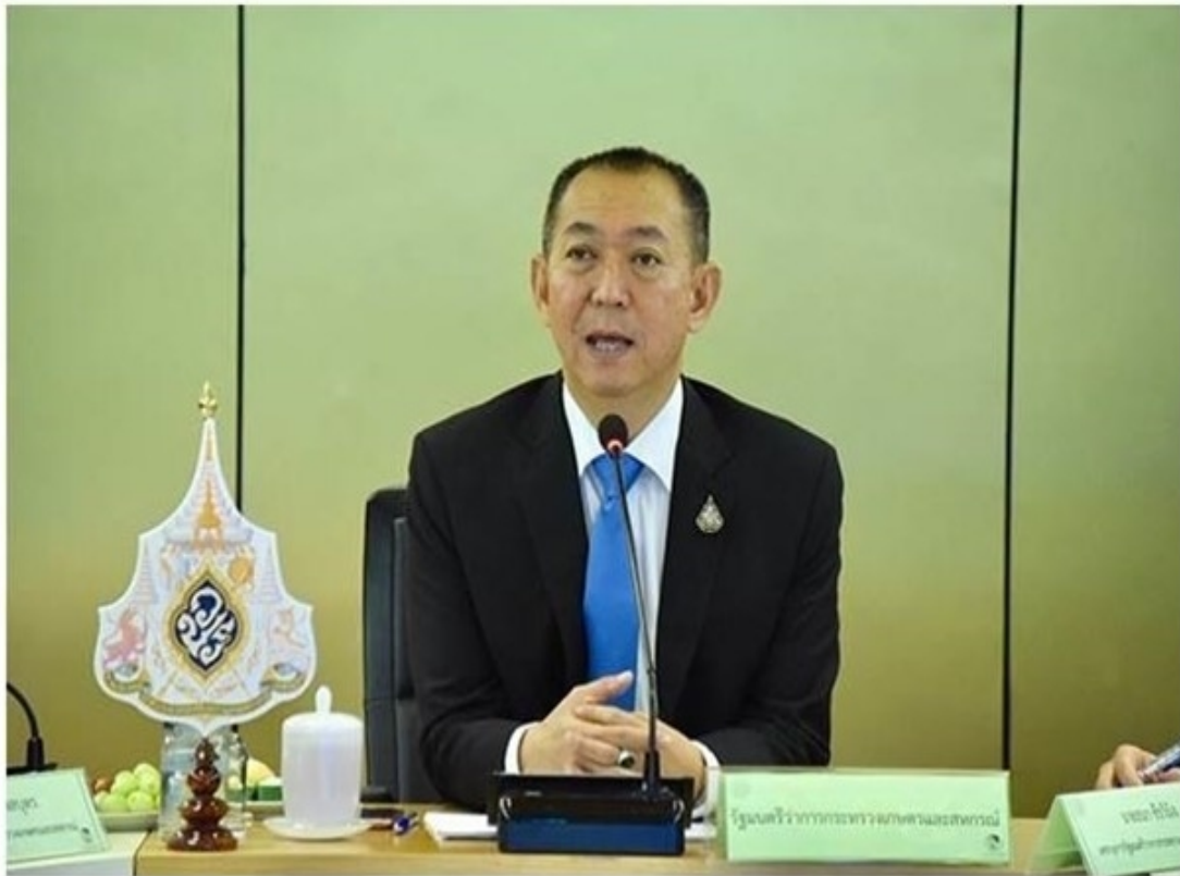
รมว. กษ. หรือผู้ประกอบการและผู้แทนเกษตรกรชาวสวนยาง พร้อมชี้แจงแนวทางการดำเนินงานของ กยท.