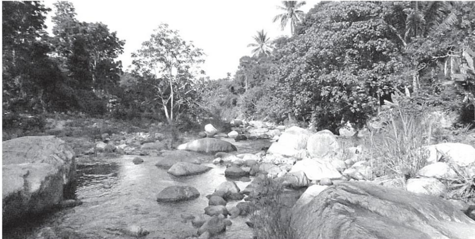
ภาพมุมหนึ่งของคลองวังหีบซึ่งมีน้ำใสไหลเย็นเห็นตัวปลาและจะกลายเป็นเขื่อนในอนาคตขณะที่กลุ่มอนุรักษ์คัดค้านการก่อสร้างอ้างว่าเป็นการทำลายสิ่งแวดล้อม ทำให้โครงการก่อสร้างไม่สามารถเดินหน้าต่อไป.