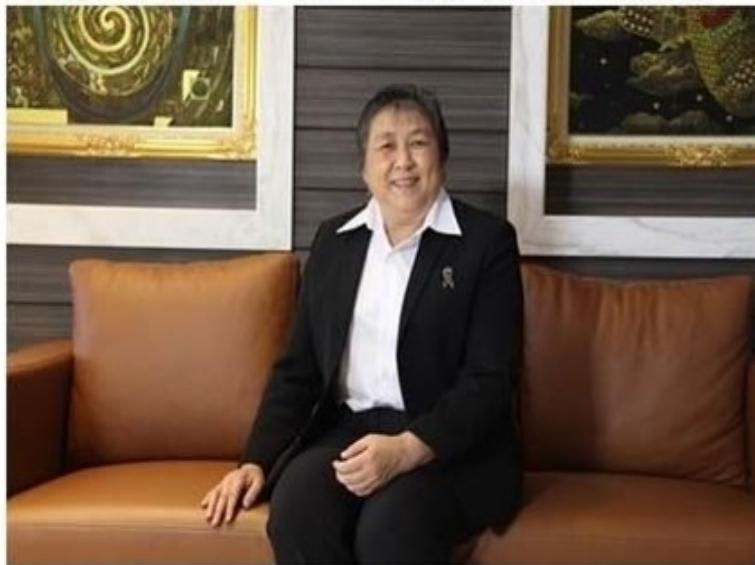
ดูรูปทั้งหมด

ข่าวทั่วไป ThaiPR.net -- อังคารที่ 27 สิงหาคม 2562 11:17:58 น.