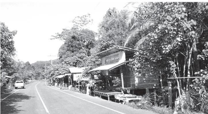
ถนนที่จะเข้าไปยังโครงการสร้างเขื่อน โดยสองฝากถนนเป็นสวนยางพารา และสวนผลไม้ มีบ้านเรือนประชาชนอาศัยอยู่.

วงเงินงบประมาณทั้งสิ้น 2,377.644 ล้านบาท (ราคาเขื่อน 918.85 ล้านบาท ค่าควบคุมงาน เขื่อน 27.57 ล้านบาท ค่าที่ดิน 210 ล้านบาท ค่าสิ่งแวดลอม 86.40 ล้านบาท งานส่วนประกอบอื่นๆ 323.83 ล้านบาท และอื่นๆ 114.59 ล้านบาท)