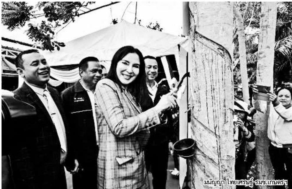
มณัญญา ไทยเศรษฐ์ รัฐมนตรี

การ ลงพื้นที่ 3 จังหวัดภาคใต้ตอนล่าง ประกอบด้วย พัทลุง สตูล และสงขลา ช่วงสัปดาห์ที่ผ่านมาของรัฐมนตรีช่วยว่าการกระทรวงเกษตรและสหกรณ์ "มณัญญา ไทยเศรษฐ์" และคณะ เพื่อตรวจราชการในพื้นที่และติดตามการดำเนินงานตามงานกระทรวงเกษตรฯ ในการพัฒนาสหกรณ์ และใช้ขบวนการสหกรณ์ช่วยเหลือเกษตรกรเพิ่มมูลค่ายางพาราในการผลิตและการตลาดสินค้าเกษตรภายใต้นโยบายรัฐบาล "ตลาดนำการเกษตร" การลงพื้นที่ครั้งนี้ได้ตรวจเยี่ยมการดำเนินการของสหกรณ์ในหลายจุด เริ่มจากวิสาหกิจชุมชนกลุ่มอาชีพสหกรณ์บ้านพังคาน ต.นาขยาด อ.ควนขนุน จ.พัทลุง ซึ่งได้ดำเนินการแปรรูปไม้ยางสดเป็น