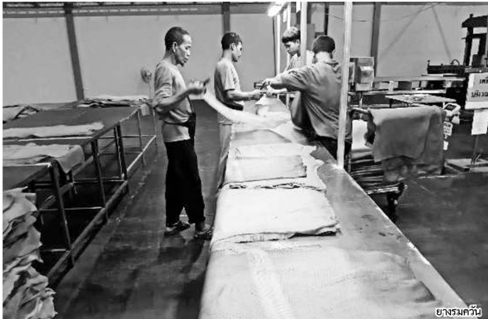
ยางรมควัน

หัวข้อข่าว: หนุน'สหกรณ์'เพิ่มมูลค่ายางพาราผืนกมนาคมผลิต'กรวยยาง-แบรีเออร์'