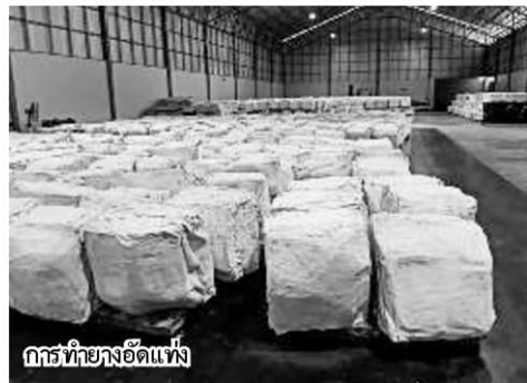
กรวยยางอัดแท่ง

อาหารพืชในดิน และพบปะสมาชิกสหกรณ์ในพื้นที่ อ.นาทวี และอ.สะบ้าย้อย จ.สงขลา โดยสหกรณ์