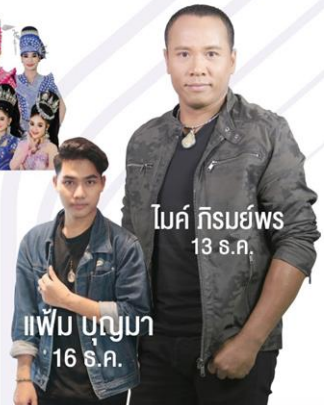
โมค์ กิรมย์พ 13 ส.ค.