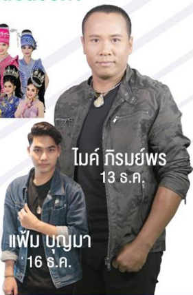
โม้ค กิรัมย์พอส 13 ธ.ค.