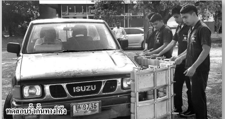
ทดสอบวิ่งกันทางโค้ง

สำหรับ 2 นวัตกรรมจากยางล่าสุดก็คือ ผลิตภัณฑ์แท่งแบร์รีเออร์ จากยาง ซึ่งมีการพัฒนาประสิทธิภาพให้สูงขึ้น ด้วยการเสริมสาร แคลเซียมคาร์บอเนต และผลิตภัณฑ์แผ่นกันถนนทางโค้งจากยาง ที่ได้มีการเสริมสารซิลิกาเข้าไป โดยผลิตจากน้ำยางข้นชนิดครีม ที่ ผ่านกระบวนการวิจัย ศึกษาสูตร วิเคราะห์ พร้อมทั้งออกแบบ จาก คณะครูแผนกวิชาเทคโนโลยียางและพอลิเมอร์ ซึ่งได้รับงบประมาณ