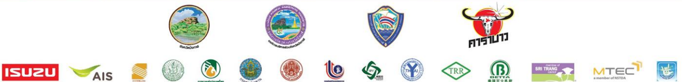
แพ้ม บุญมา 16 ส.ค.