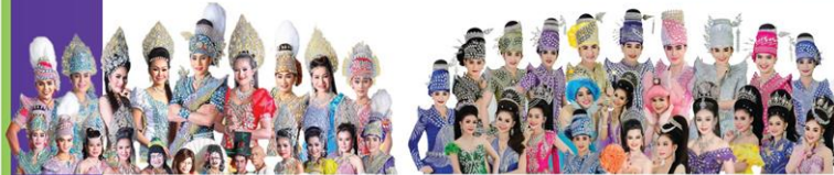
ประถมนันทศิลป์ 17 ธ.ค.