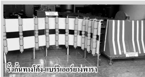
รั้วกันทางโค้ง-แบร์รี่เออร์ยางพารา

หัวข้อข่าว: 'เทคนิคตรัง' เจ๋งแปรรูปน้ำยางพาราผลิต 'แบร์รี่เออร์' ช่วยจรรจบลดภัย