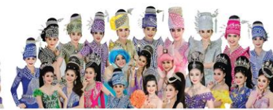
ระเบียบวาทะศิลป์ 18 ส.ค.