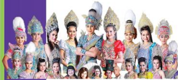
ประณมบันเทิงศิลป์ 17 ส.ค.