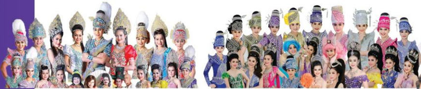
ประถมนันท์ศิลปิน 17 ส.ค.

บึงกาฬมาร์เก็ต สินค้า OTOP และสินค้านานาชาติ ม่วนซื่นโฮแซวกับคอนเสิร์ตศิลปินชื่อดัง