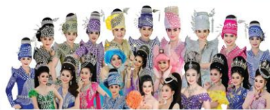
ระเบียบวาทะศิลป์ 18 ธ.ค.