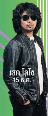
เสก โลโซ 15 ส.ค.