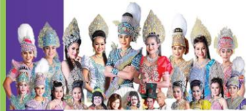
ประณมบันเทิงศิลป์ 17 ส.ค.