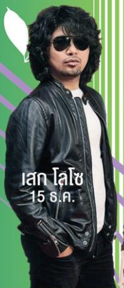
เลก โลไซ 15 ส.ค.

บึงกาฬมาร์เก็ต สินค้า OTOP และสินค้านานาชาติ ม่วนซื่นโฮเฮาแซกกับคอนเสิร์ตศิลปินชื่อดัง