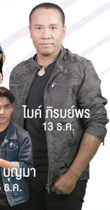
โมค์ ทิรมย์พ 13 ส.ค.