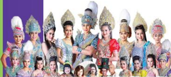
ประถมนบันเทิงศิลป์ 17 ธ.ค.