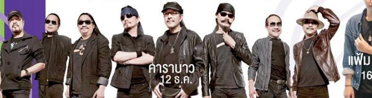
คาราบาว 12 ส.ค.