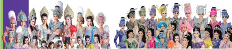
ประมบัณฑิตศิลป์ 17 ส.ค.