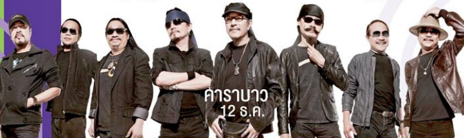
คาราบาว 12 ธ.ค.