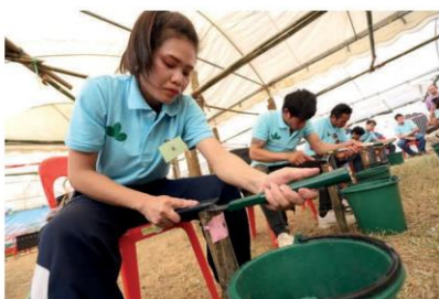
แข่งขันลับมีดกรีดยาง

ในช่วงการจัดงาน มีการเปิดโรงงานผลิตหมอนยางพารา ซึ่งถือเป็นการดำเนิน