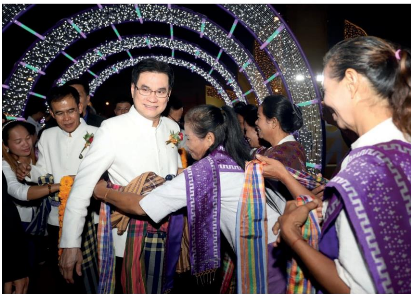
นายจรินทร์ ลักษณวิศิษฏ์ รองนายกรัฐมนตรี และรัฐมนตรีว่าการกระทรวงพาณิชย์ เป็นประธานเปิดงาน