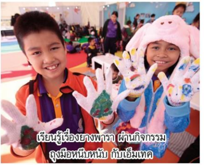
เรียนรู้เรื่องยางพารา ผ่านกิจกรรมถุงมือหัตถ์กับเอ็มเทค