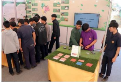
นวัตกรรมผลงานวิจัยของ พระจอมเกล้าพระนครเหนือ ได้รับความสนใจจากผู้ชมงาน

ประธานในพิธีเปิด งานยิ่งใหญ่อลังการ โดยสรุปแล้วการจัดงานในครั้งนี้ ถือว่าประสบความสำเร็จอย่างมากกับบึงกาฬโมเดล 2020 ส่วนในปีต่อไปจะมีการเพิ่มเติม โดยการเชิญต่างประเทศที่มีกิจกรรมเกี่ยวกับการทำยางพาราร่วมออกบูธ และแลกเปลี่ยนองค์