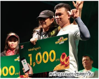
คาราบอมอบโชคทุกวัน