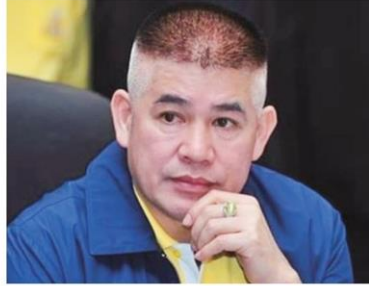
ร.อ.ธรรมนัส พรหมเผ่า

ทั้งนี้ในปี 2563 รัฐบาลมีเป้าหมายที่จะใช้ยางพาราในประเทศประมาณ 90,000 ตัน แบ่งเป็นกระทรวงคมนาคมคาดว่า