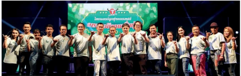
10 คนสุดท้ายเข้ารอบชิงชนะเลิศ การประกวดบึงกาฬพันธุ์

นอกจากนี้ ภายในงาน มีหน่วยงานราชการของจังหวัดได้เข้าร่วมโชว์ผลงานหลายหน่วยงาน อาทิ หอการค้าจังหวัด สำนักงานเกษตรจังหวัด สำนักงานพลังงานจังหวัด แขวงทางหลวงจังหวัด ซึ่งช่วยเสริมสร้างความรู้และการพัฒนาจังหวัดอีกทางหนึ่งด้วย