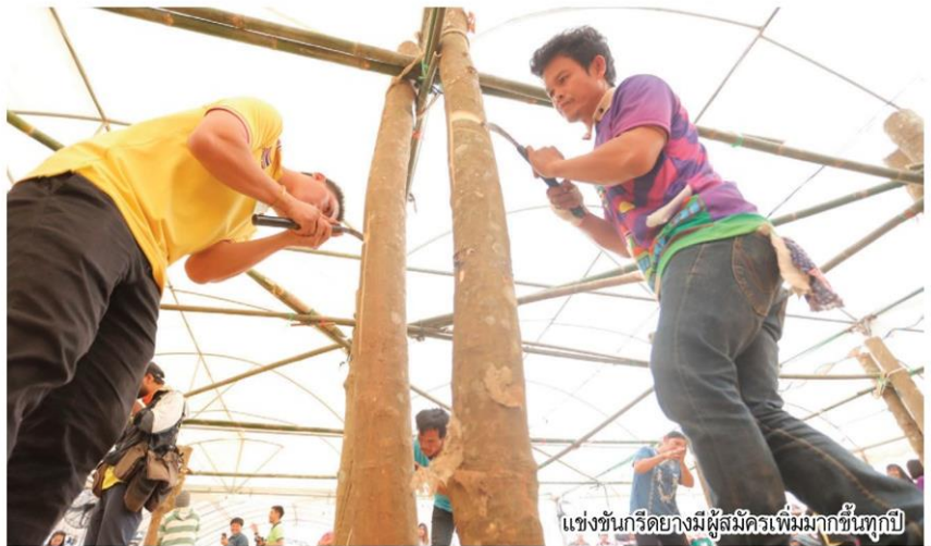
แข่งขันกรีดยางมีผู้สมัครเพิ่มมากขึ้นทุกปี

ทุกปี จังหวัดบึงกาฬ ได้ร่วมกับ องค์การบริหารส่วนจังหวัด หน่วยงานราชการ และเอกชน กำหนดจัดงานวันยางพารา บึงกาฬ มหกรรมยางพารายิ่งใหญ่ที่สุดในภาคอีสาน และเป็นงานประจำปีที่สำคัญของจังหวัดบึงกาฬ โดยปีนี้ “วันยางพาราบึงกาฬ 2563” จัดขึ้นเป็นครั้งที่ 8 ระหว่างวันที่ 12 - 18 ธันวาคม 2562 ณ สนามหน้าที่ว่าการอำเภอเมือง จังหวัดบึงกาฬ ภายใต้แนวคิด “บึงกาฬโมเดล 2020” ต้นแบบความสำเร็จของการแก้ปัญหา และการพัฒนายางพาราระดับประเทศ ภายในงานมีนิทรรศการความรู้และนวัตกรรมด้านยางพารามาจัดแสดงมากมาย อาทิ นวัตกรรมและงานวิจัยจากศูนย์เทคโนโลยีโลหะและวัสดุแห่งชาติ (MTEC) มหาวิทยาลัยเทคโนโลยีพระจอมเกล้าพระนครเหนือ (มจพ.) การยางแห่งประเทศไทย (กยท.)