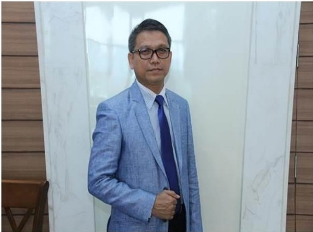
กรุงเทพฯ--9 ม.ค.--การยางแห่งประเทศไทย