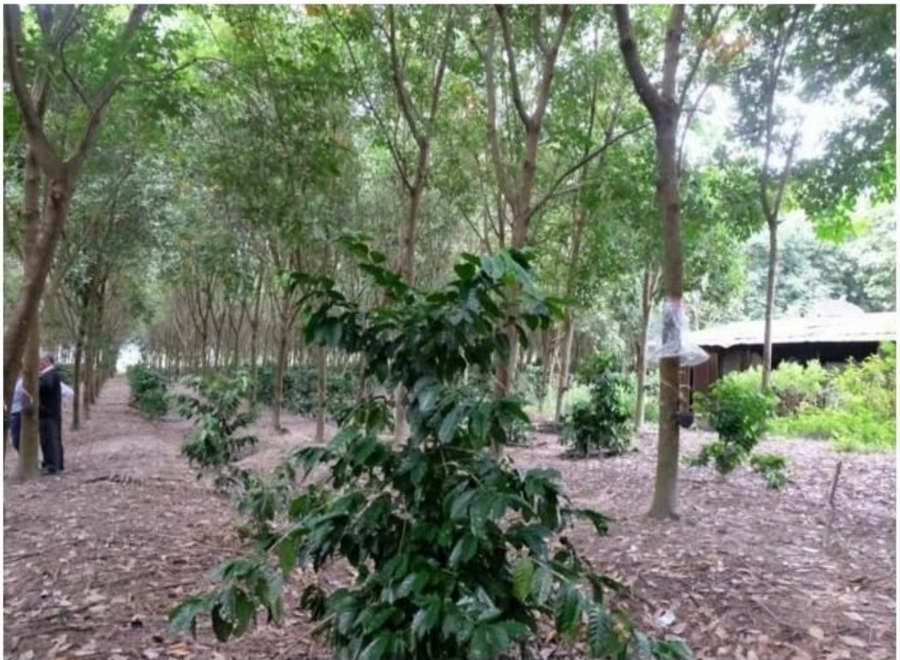
เกษตรกรผสมผสานโดย "สมจิตร์ บรรณจักร์" เกษตรกรชาวเชียงใหม่ มีแนวคิดปลูกกาแฟสายพันธุ์อาราบิก้าใต้ต้นยางพารา พร้อมเลี้ยงสัตว์และพืชอื่นๆ ควบคู่กับการทำสวนยาง (ภาพจากเว็บไซต์ rubber.co.th)

"กยท.ในฐานะหน่วยงานที่รับผิดชอบ รวมทั้งกรมป่าไม้ สภาอุตสาหกรรมแห่งประเทศไทย ตลอดจนสถาบันการศึกษาที่พยายามช่วยอยู่ ถ้าเราเตรียมให้เสร็จภายใน 4-6 ปี ไม่ว่าจะมาตรฐานอะไรมาเราก็รับได้ นี่คือสิ่งที่ต้องทำตอนนี้"