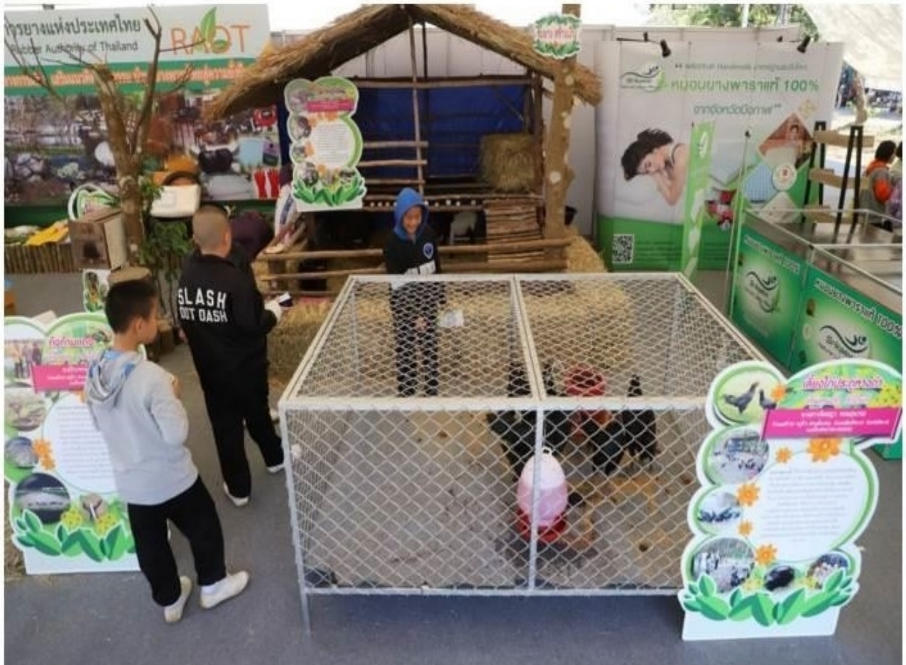
กยท. ออกบูธให้ความรู้เรื่องการเลี้ยงสัตว์ควบคู่กับการทำสวนยางพารา ภายในงานวันยางพาราชิงกาฬ 2563