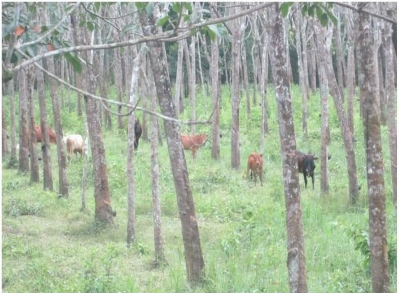
เลี้ยงโคในสวนยาง หนึ่งในทางรอดของเกษตรกรชาวสวนยางภาคใต้

"เราไม่ได้มองพอยต์เรื่องการออกใบรับรอง เพื่อรองรับสวนยางยั่งยืนเป็นหลัก แต่มองว่าสวนยางยั่งยืนสามารถพิสูจน์ตัวเองได้ อยู่ด้วยตัวเองได้ ไม่ว่าจะมาตรฐานอะไร หรือประเทศอะไรกำหนดมา เกษตรกรก็อยู่ได้ ฉะนั้นเราควรเตรียมตัววันนี้ให้ดีที่สุด ไม่ใช่มาตรฐานอะไรมาแล้วค่อยทำ"